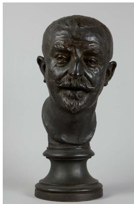
Pierre Roche, Buste de Joris-Karl Huysmans , 1900, bronze, Petit Palais