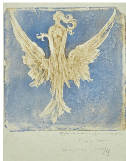
Pierre Roche, Femmes-cygnets (volantes) VI. L'arrêt , 1916. Gypsographie, tirage en marron et bleu. Petit Palais.

Cet accrochage, rendu possible grâce au don par sa famille d'un ensemble exceptionnel de 4 000 pièces provenant directement de son atelier, est réparti en 7 chapitres autour d'une centaine d'œuvres. Il permettra de présenter les différentes facettes et l'originalité de son œuvre.