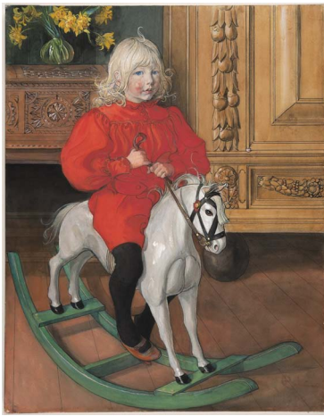
6. Carl Larsson, « Murre ». Casimir Laurin Aquarelle, 1900 © Nationalmuseum Stockholm