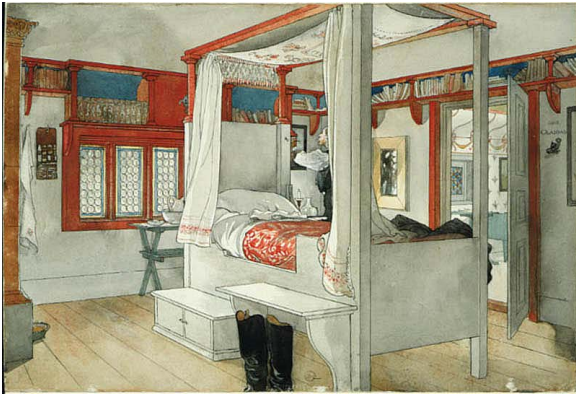
1. Carl Larsson, La chambre de Papa Aquarelle pour l'album « Notre Maison », 1894-1896