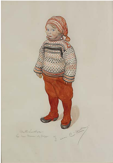
5. Carl Larsson, Matts Larsson Aquarelle, 1911 © Nationalmuseum Stockholm