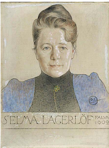
7. Carl Larsson, Portrait de Selma Lagerlöf Craie et huile sur toile, 1902