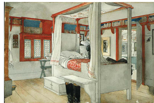
Carl Larsson, La chambre de papa Aquarelle pour l'album « Notre Maison », 1894-1896