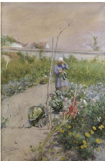
4. Carl Larsson, Dans le jardin potager Aquarelle, 1883