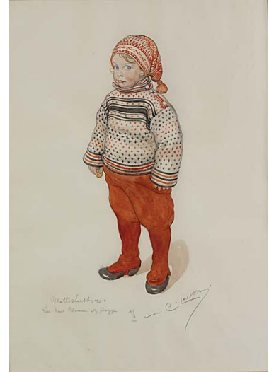
Carl Larsson Matts Larsson Aquarelle, 1911

Organisée avec le concours exceptionnel du Nationalmuseum de Stockholm.