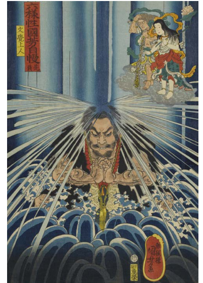
Utagawa Kuniyoshi (1797-1861), Le moine Mongaku, de la série Les six figures favorites de Kuniyoshi mises en correspondance avec le cycle des six jours, 1860. Estampe, 39 x 26,5 cm. Collection particulière.