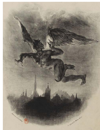
Eugène Delacroix, Faust : Méphistophélès dans les airs , 1827 Lithographie. Bibliothèque nationale de France.

Gaëlle Rio , conservateur au Petit Palais