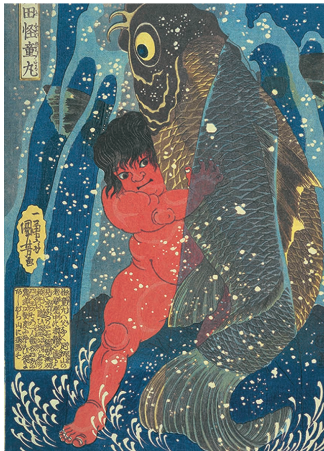
Utagawa Kuniyoshi (1797-1861), Sakata Kaidō-maru, 1836. Nishiki-e, format ōban (39 × 26,5 cm). Collection particulière.

Le Petit Palais propose à l'automne une saison sur le thème du Fantastique à travers deux grandes expositions d'estampes.