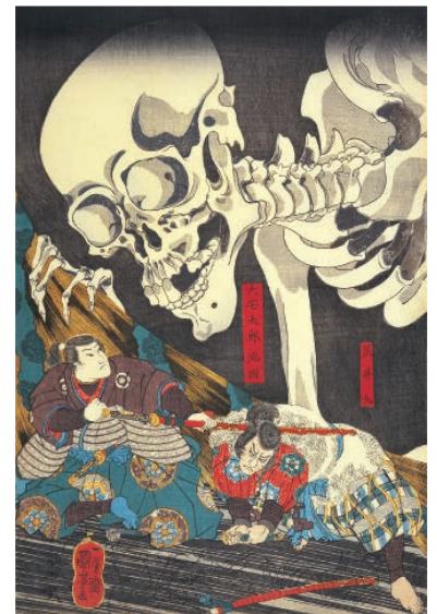
Utagawa Kuniyoshi (1797-1861), La Princesse Takiyasha appelant un monstrueux fantôme squelettique à l'ancien palais, à Soma, 1845-1846. Partie centrale du triptyque, 39 x 26,5 cm. Collection particulière.