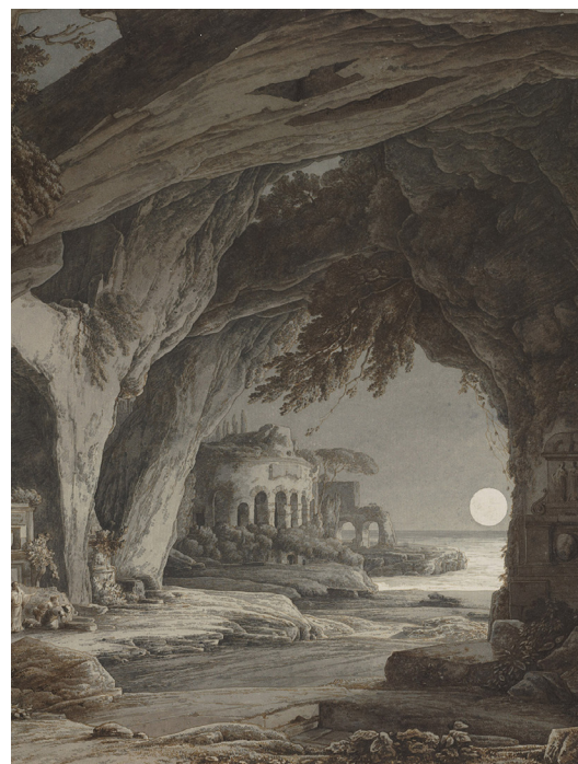
Franz Kobell, Paysage idéal avec grotte, tombeaux et ruines au clair de lune (détail), vers 1787

mathilde.beaujard@paris.fr / 01 53 43 40 14