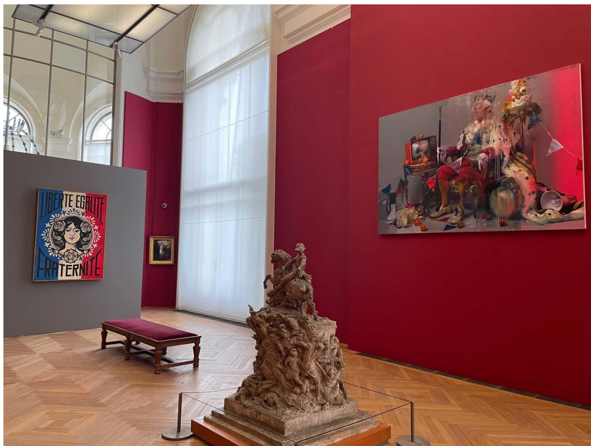
SHEPARD FAIREY (OBEY) Liberté, Égalité, Fraternité , 2024 @itinerrance CONOR HARRINGTON Down with the king , 2024 @itinerrance

En explorant ces codes, les artistes invités - dans la richesse de leurs différences - réinvestissent les valeurs de la République et célèbrent la diversité et la pluralité qui caractérisent la France d'aujourd'hui. Les artistes provoquent ainsi le dialogue et la réflexion sur les enjeux sociaux et politiques contemporains.