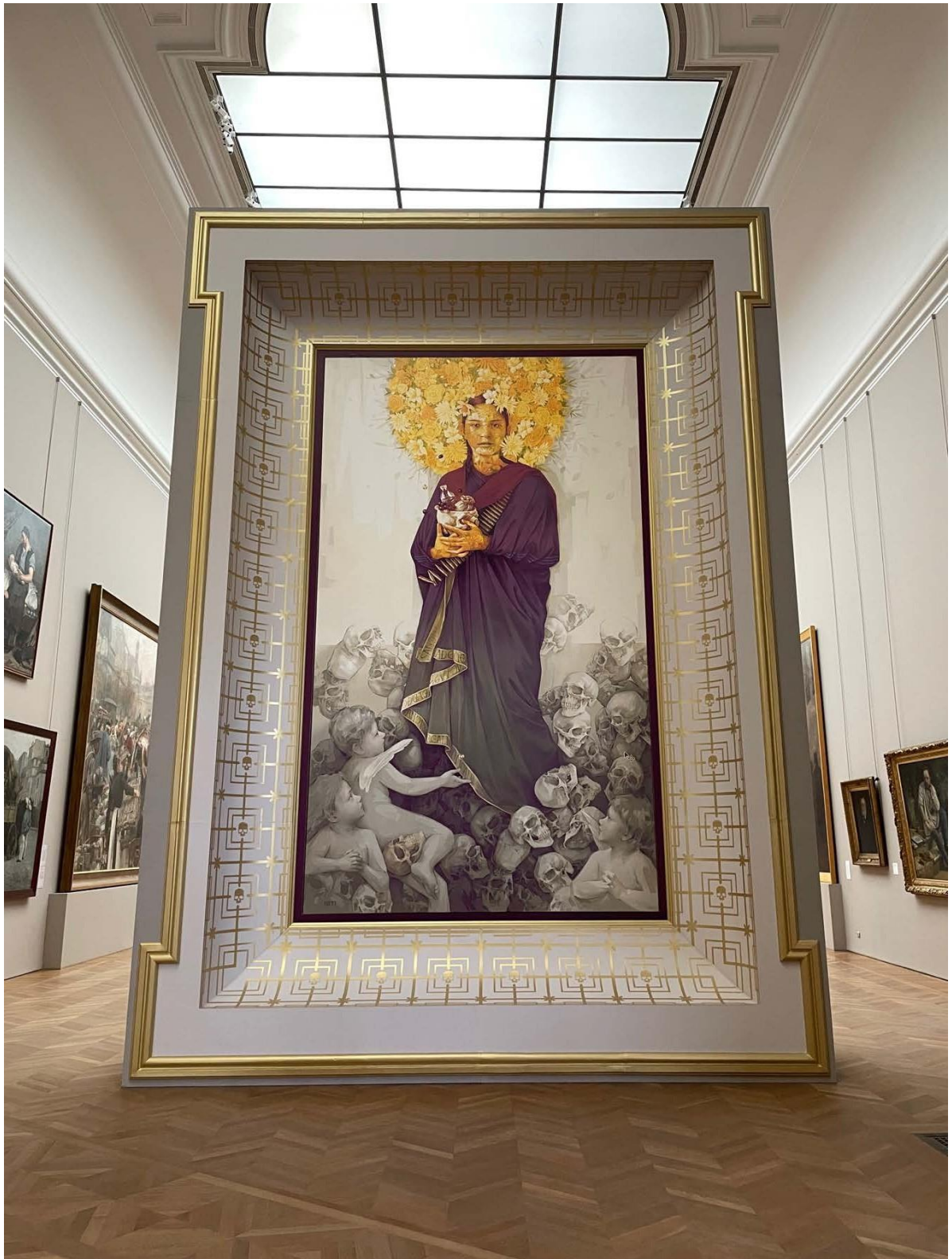
INTI Encomendacion , 2024

DABRO Châtelet-les-Halles , 2024 Technique mixte (peinture à l'huile et spray aérosol) Galerie des Grands Formats