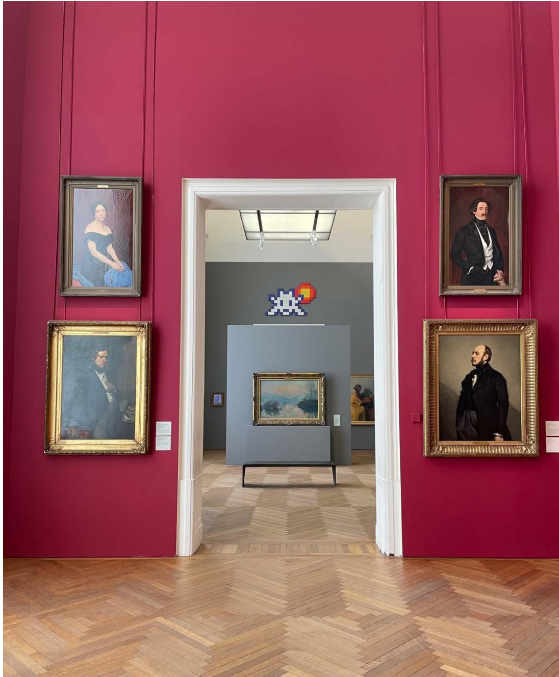
INVADER DJBA_28, 2019 @Itinerrance

Biographies des artistes sur simple demande.