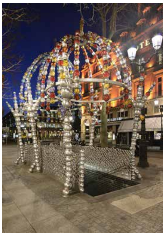
Jean-Michel Othoniel, Le Kiosque des Noctambules , 2000 Photo : Philippe Saharoff © Jean-Michel Othoniel / Adagp, Paris, 2021

En 2000, Jean-Michel Othoniel répond pour la première fois à une commande publique et transforme la station de métro parisienne Palais-Royal– Musée du Louvre en Kiosque des Noctambules . Sa création se partage dès lors entre les lieux publics et les espaces muséaux ; en 2003, pour l'exposition « Crystal Palace » présentée à la Fondation Cartier pour l'art contemporain à Paris et au MOCA de Miami, il fait réaliser à Venise et au Centre international du Verre à Marseille (Cirva) des formes de verre soufflé, destinées à devenir d'énigmatiques sculptures, entre bijoux, architectures et objets érotiques.