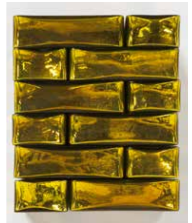
Jean-Michel Othoniel, Precious Stonewall , 2019 Photo : Livia Saaverda © Jean-Michel Othoniel / Adagp, Paris, 2021

La Couronne de la nuit vient d'une forêt du nord de l'Europe, longtemps cette sculpture est restée cachée sous les chênes tricentenaires d'une futaie cathédrale. Aujourd'hui, telle une araignée de verre et de couleurs, elle emplie la coupole immaculée de l'escalier nord, en écho à la coupole sud peinte par Maurice Denis. Elle nous invite à quitter sa lumière pour descendre l'escalier vers un univers plus obscur, accueilli par le funeste groupe d'Ugolin prêt à dévorer ses enfants, sculpté par un Carpeaux envoûté par l' Enfer de Dante.