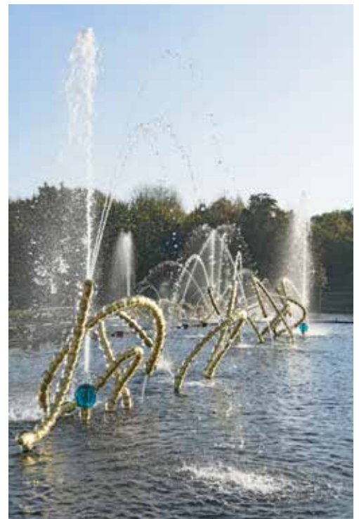
Jean-Michel Othoniel, Les Belles Danses , Versailles, 2015, L'Entrée d'Apollon (détail) Photo : Philippe Chancel © Jean-Michel Othoniel / Adagp, Paris, 2021

L'année 2015 est marquée par la réalisation d'un projet d'exception: le réaménagement, avec le paysagiste Louis Benech, du bosquet du Théâtre d'Eau dans les jardins du Château de Versailles. Pour cette commande, passée à l'issue d'un concours international, Jean-Michel Othoniel crée trois sculptures fontaines en verre doré, inspirées des chorégraphies du Maître de danse du roi Louis XIV, Raoul-Auger Feuillet. L'artiste réalise, avec Les Belles Danses , la première œuvre pérenne au sein du palais commandée ainsi à un artiste contemporain. Développées comme un projet d'architecture, ces trois sculptures fontaines répondent à quelques-unes des grandes orientations que le travail de l'artiste a récemment empruntées: la dimension monumentale et la relation à l'histoire qui sont de plus en plus au nombre de ses singularités.