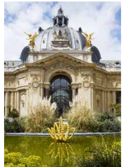
Jean-Michel Othoniel, Gold Lotus , 2019 Photo : Claire Dorn / Courtesy of the Artist & Perrotin © Jean-Michel Othoniel / Adagp, Paris, 2021