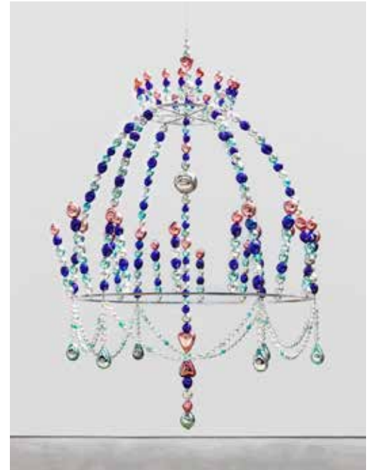
Jean-Michel Othoniel, La Couronne de la Nuit , 2008 Collection du Petit Palais

Par son esthétique, cette œuvre rappelle le Kiosque des noc tambules (2000), situé près de la Comédie française à Paris, pour lequel l'artiste s'est inspiré des arabesques Art Nouveau d'Hector Guimard, dont un ensemble de boiseries est présenté au Petit Palais. Constituée de perles en verre de Murano soufflées, la Couronne revêt à la fois un côté magique, dû à sa filiation avec des objets de culte populaire, et merveilleux, lié à son évocation des rois et des reines de contes de fées. Montrée pour la première fois en 2008 dans une forêt plusieurs fois centenaire des Pays-Bas, à Sonsbeeck, elle marque ici le franchissement d'une nouvelle étape. En passant sous elle, le visiteur quitte ainsi le jardin paradisiaque, pour accéder au domaine plus obscur des bas-fonds souterrains. En bas, l'Ugolin de Jean-Baptiste Carpeaux (1827-1875), prêt à dévorer ses propres enfants, marque l'entrée de l'Enfer ; ou du moins, de l'antre imaginaire conçue par l'artiste.