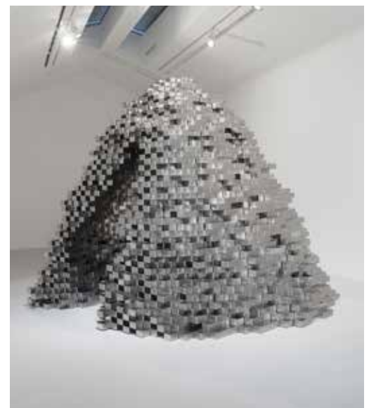
Jean-Michel Othoniel, Agora , 2019 Photo : Claire Dorn / Courtesy of the Artist & Perrotin © Jean-Michel Othoniel / Adagp, Paris, 2021

Les tableaux en verre coloré qui ornent ici les murs de la rotonde inférieure sont le produit d'une pratique quasiment méditative, exercée au jour le jour par l'artiste durant ses périodes de confinement, en 2020, renouant par la force des choses, avec l'isolement érémitique. Inspirés par des œuvres minimalistes d'artistes américains des années 1960, ces « murs de pierres précieuses » ou « Precious Stonewalls » conjuguent aux lignes épurées de leur forme, presque zen, la richesse baroque, vibrante et minérale de leur couleur.