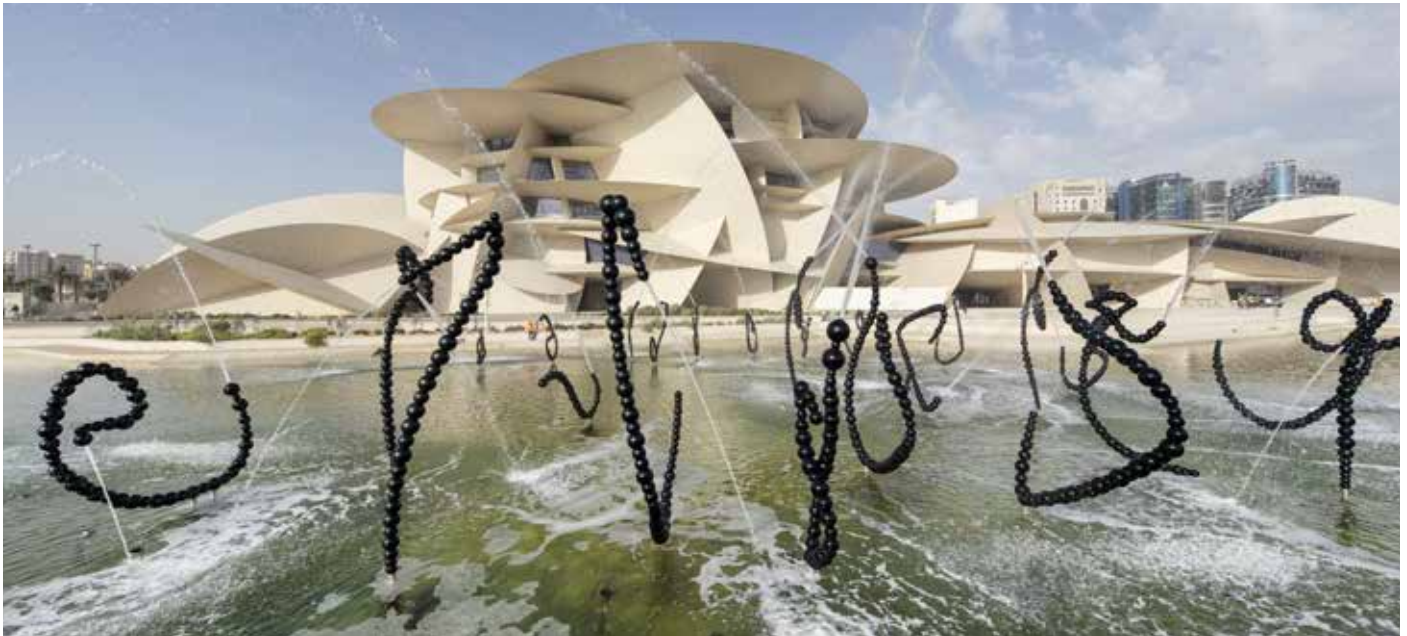
Jean-Michel Othoniel, Alfa , 2019

La même année, il réalise Alfa pour Le nouveau Musée national du Qatar, conçu par l'architecte Jean Nouvel, un projet conçu à l'échelle monumentale du bâtiment. Elle comprend 114 sculptures fontaines dont les jets d'eau évoquent les formes fluides de la calligraphie arabe.