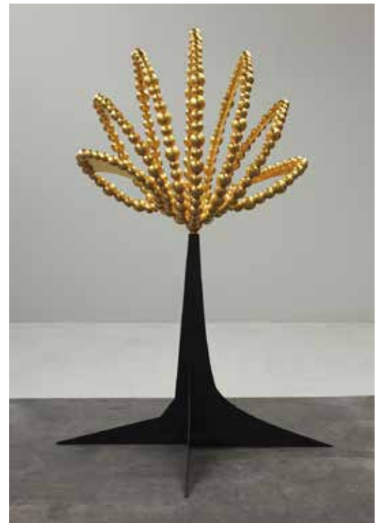
Jean-Michel Othoniel, Gold Lotus , 2015 Kukje Gallery, Séoul Photo : Claire Dorn / Courtesy of the Artist & Perrotin © Jean-Michel Othoniel / Adagp, Paris, 2021

Dans la verdure, au milieu des acanthes et des palmiers, se révèlent d'autres merveilles : des Colliers précieux, accrochés aux branches. Dorés, ils font écho aux guirlandes suspendues du péristyle ; mais ils apportent aussi une autre dimension, de l'ordre du désir et de la sensualité, tout comme les colliers dressés au sol, dans les alcôves du péristyle. Dans les bassins aux mosaïques turquoise et violette, évocateurs des jardins orientaux, trois lotus dorés se mirent dans une eau, dont l'image se reflète à son tour à travers les perles-miroirs qui les composent. Ils rappellent la fleur jaune dans laquelle Narcisse, épris de sa propre image, a fini par être transformé. L'homme et son image, ici interrogés, peuvent être vus comme le dédoublement de l'artiste et son œuvre ; ou comme le visiteur qui, pris dans ce jeu, peut découvrir à travers ce reflet une certaine image méconnue du monde, et de lui-même.