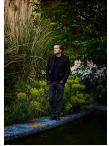
Portrait de Jean-Michel Othoniel, 2021 Photo : Claire Dorn / Courtesy of the Artist & Perrotin © Jean-Michel Othoniel / Adagp, Paris, 2021

En 1996, il est pensionnaire à la Villa Médicis à Rome. C'est à partir de ce moment qu'il commence à faire dialoguer ses œuvres avec le paysage, suspendant des colliers géants dans les jardins de la Villa Médicis, aux arbres du jardin vénitien de la Collection Peggy Guggenheim (1997), ainsi qu'à l'Alhambra et au Generalife de Grenade (1999).