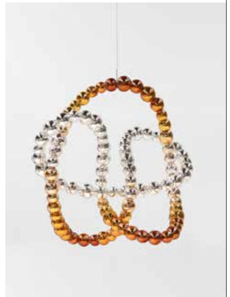
Jean-Michel Othoniel, Nœud Sauvage , 2019 Photo : Claire Dorn / Courtesy of the Artist & Perrotin © Jean-Michel Othoniel / Adagp, Paris, 2021

Les deux hommes décident de se rencontrer et entament de riches échanges. En 2017, Othoniel conçoit le Nœud infini , une sculpture de verre miroité, qu'il offre à la salle des mathématiques de l'université Nationale de Mexico (UNA), où Arroyo présente le fruit de ses recherches. Issues pour les unes, de l'œuvre personnelle d'un artiste et pour l'autre de travaux mathématiques, ces formes présentent d'étonnantes similitudes, elles ouvrent sur la notion d'un univers sensible présent dans l'infini mathématique. Cette théorie des reflets invite à une vision cosmique du « mythe de Narcisse ».