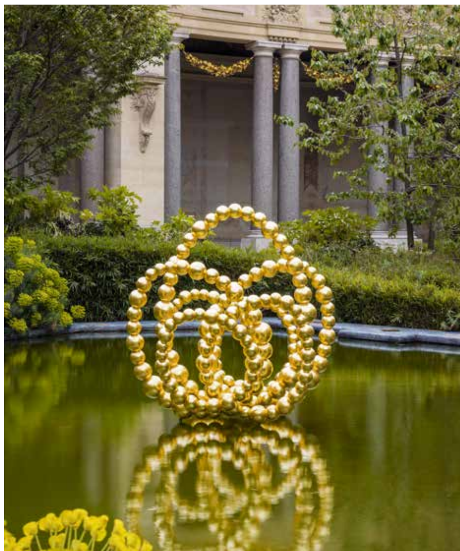
Jean-Michel Othoniel, Gold Lotus , 2019 Photo : Claire Dorn / Courtesy of the Artist & Perrotin © Jean-Michel Othoniel / Adagp, Paris, 2021