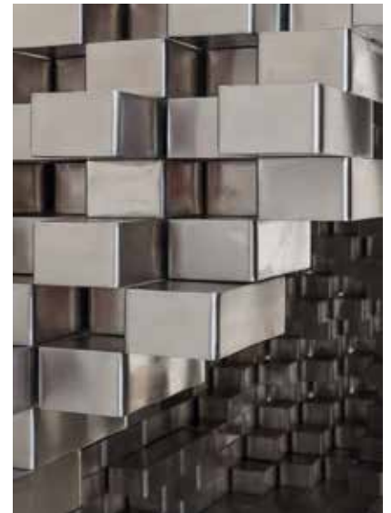
Jean-Michel Othoniel, Agora , 2019 Photo : Claire Dorn / Courtesy of the Artist & Perrotin © Jean-Michel Othoniel / Adagg, Paris, 2021

Par cette exposition, j'ai voulu créer ainsi un lieu d'irréalité, d'enchantement, d'illusion, de libération de l'imagination, un lieu à la frontière du rêve qui nous permet le temps de la visite de résister à la désillusion du monde. Constituée de plus de soixante-dix œuvres nouvelles, «Le Théorème de Narcisse» est vraiment placée sous le signe du ré-enchantement et de la théorie des reflets que j'ai développée depuis près de dix ans avec la complicité du mathématicien mexicain Aubin Arroyo et que je montre pour la première fois en France.