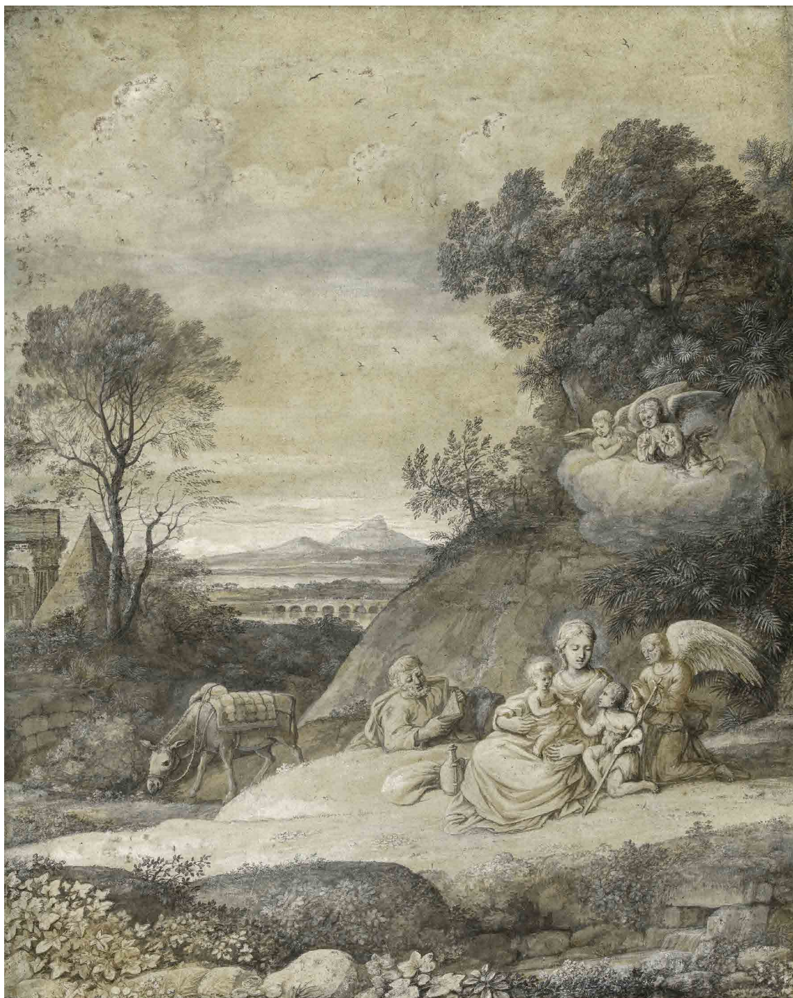
1. Claude Gellée dit Le Lorrain Le repos pendant la fuite en Egypte Pinceau, encre de chine, lavis d'encre de Chine et lavis de bistre sur papier bleuté Petit Palais

Parallèlement à l'exposition Les Bas-fonds du Baroque. La Rome du vice et de la misère où l'artiste sera représenté par un important tableau de la National Gallery de Londres, le Petit Palais montre, dans son parcours des collections permanentes (salle 25), un ensemble significatif d'oeuvres de Claude Gellée tirées de ses réserves, toutes issues de la collection Dutuit.