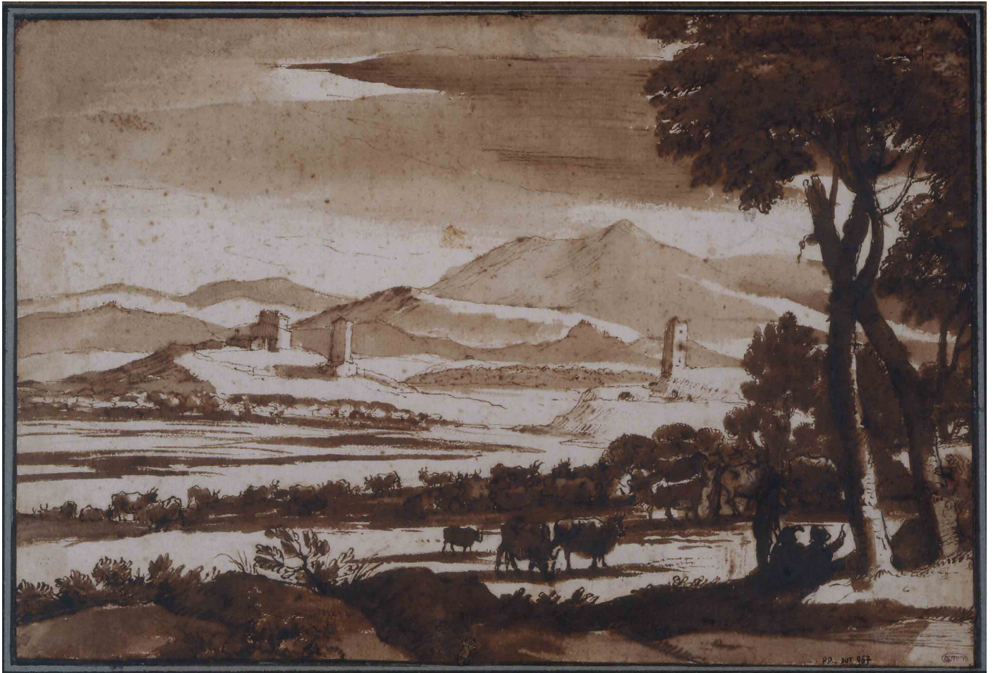
2. Claude Gellée dit Le Lorrain Vue de la vallée du Tibre, 1620-1682 Musée des Beaux-Arts de la Ville de Paris, Petit Palais