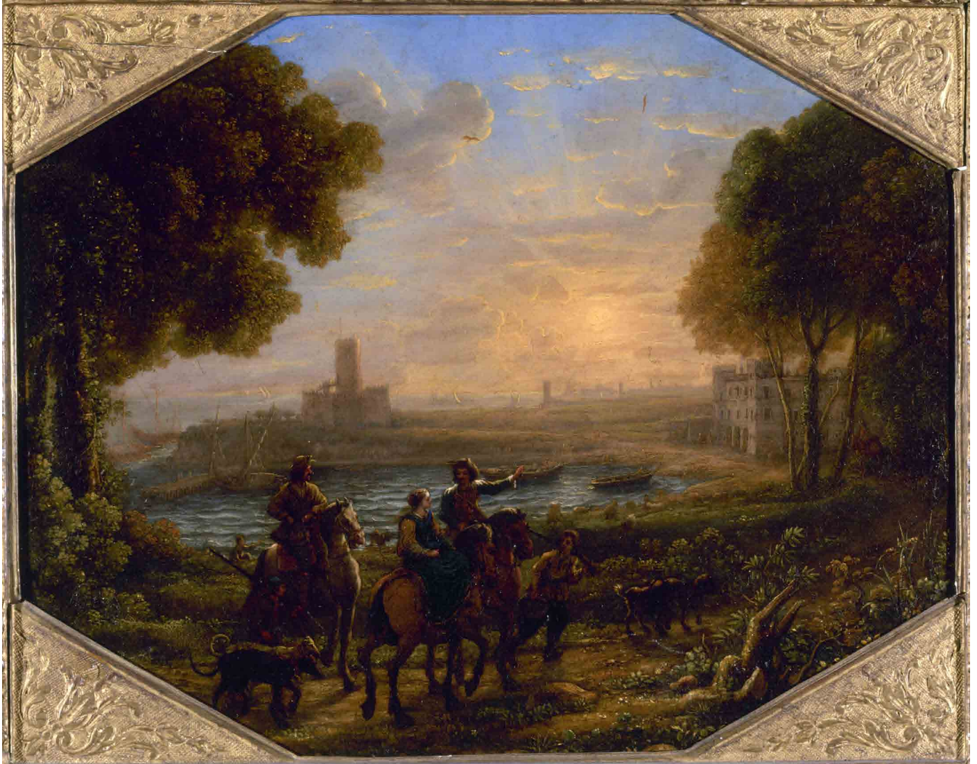
5. Claude Gellée dit Le Lorrain Paysage avec le port de Santa Marinella, 1640-1682 Musée des Beaux-Arts de la Ville de Paris, Petit Palais