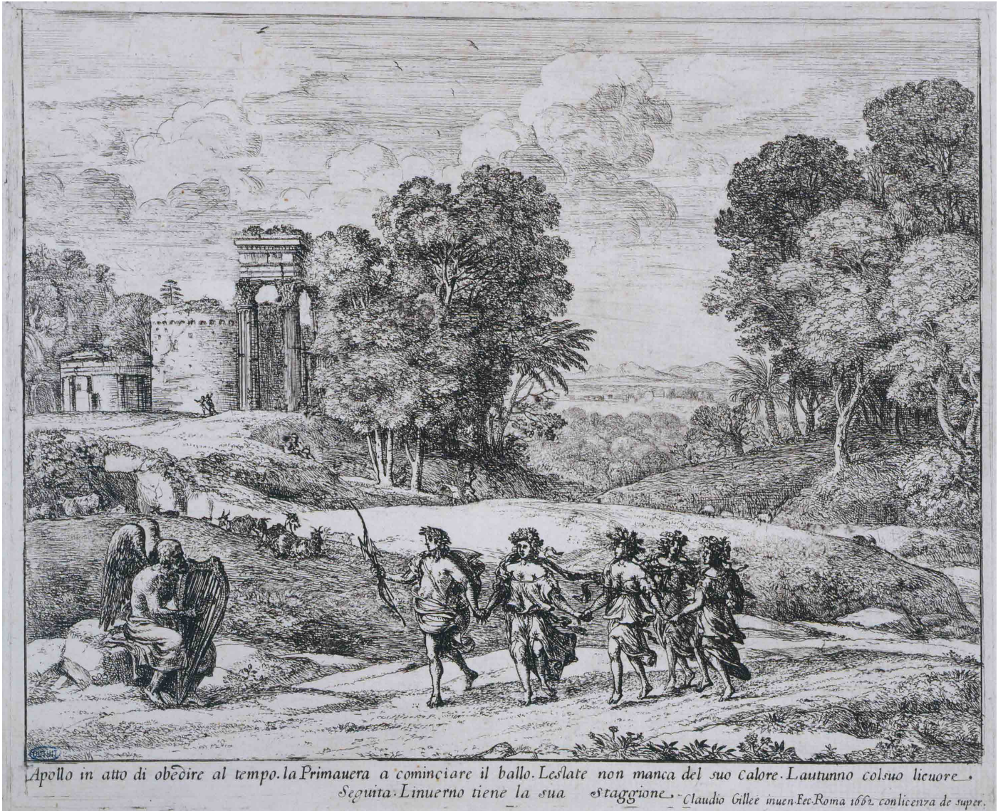
8. Claude Gellée dit Le Lorrain Le temps, Apollon et les saisons, 1640-1680 Musée des Beaux-Arts de la Ville de Paris, Petit Palais