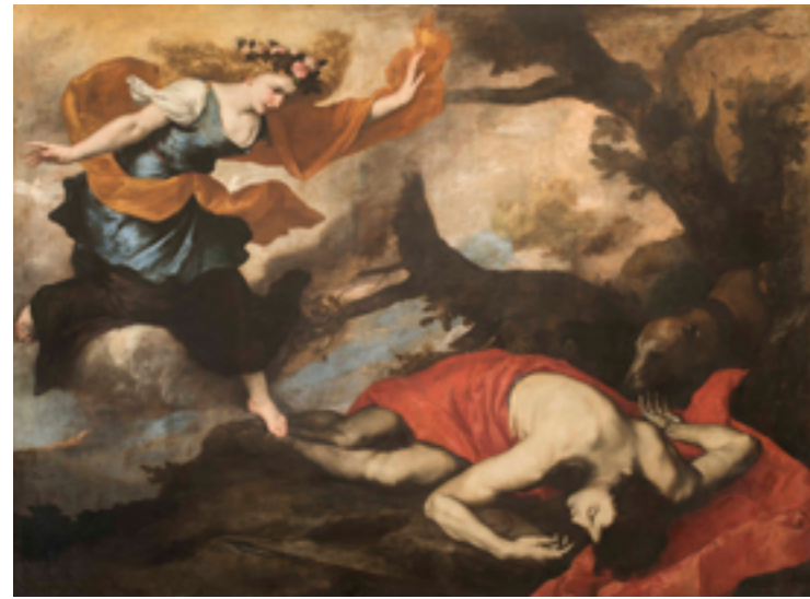
22. Jusepe de Ribera, Vénus et Adonis , 1637. Huile sur toile, 179×262 cm. Galerie Corsini, Gallerie Nazionali di Arte Antica, Rome.