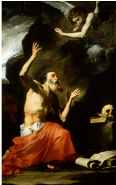
9. Jusepe de Ribera, Saint Jérôme et l'ange du Jugement dernier , 1626. Huile sur toile, 262×164 cm. Museo e Real Bosco di Capodimonte, Naples.