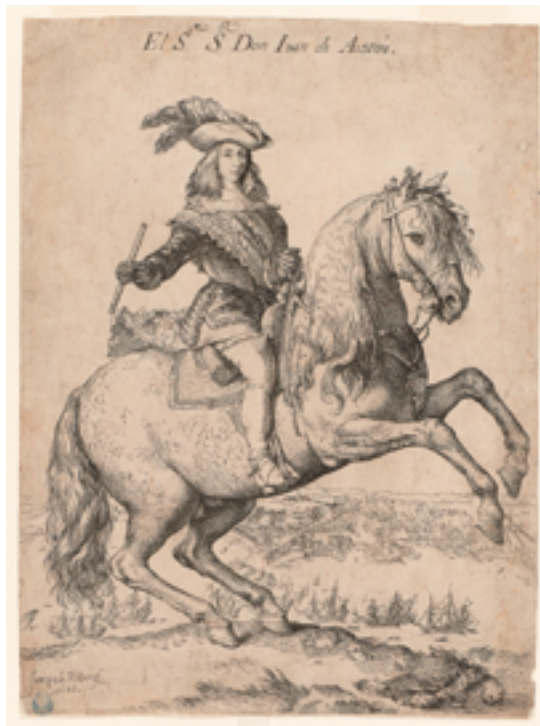
17. Jusepe de Ribera, Don Juan d'Autriche , 1648. Eau-forte et burin, 35×25,7 cm. Petit Palais, musée des Beaux-Arts de la Ville de Paris.