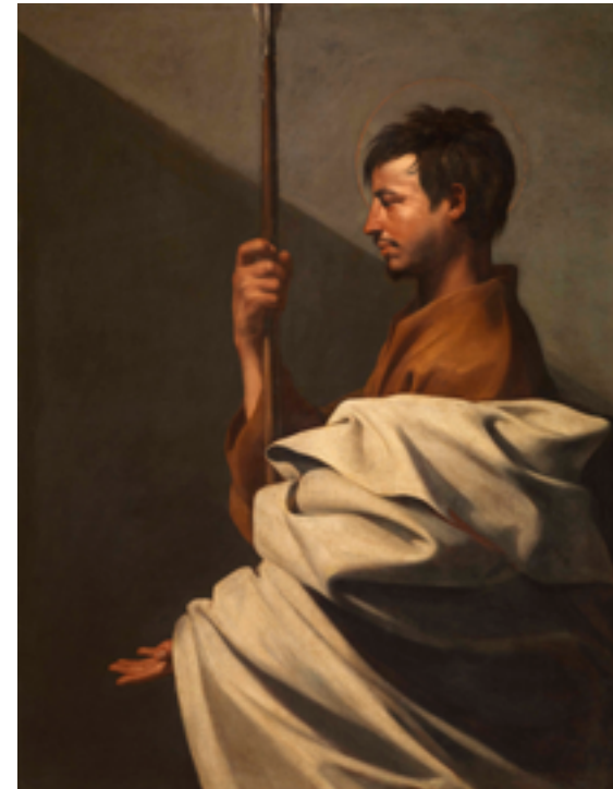
4. Jusepe de Ribera, Saint Thomas , 1612. Huile sur toile, 126×97 cm. Fondation Roberto Longhi, Florence.