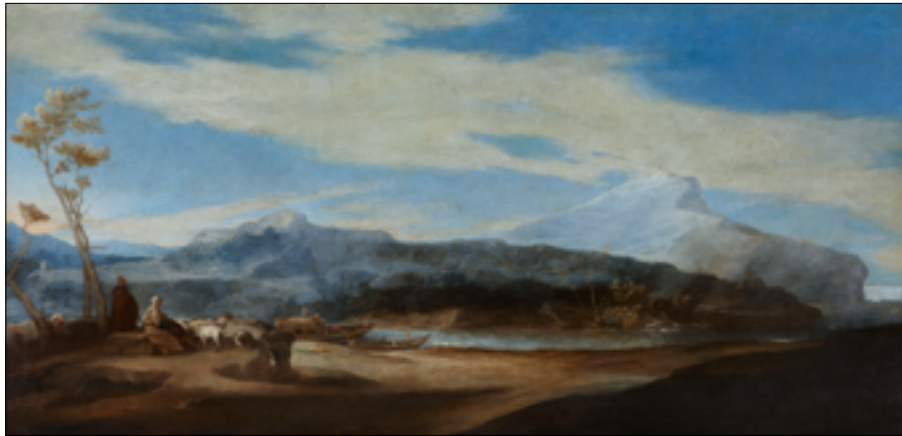
23. Jusepe de Ribera, Paysage avec bergers , 1639. Huile sur toile, 128×269 cm. Casa de Alba - Palacio de las Duenas, Séville.