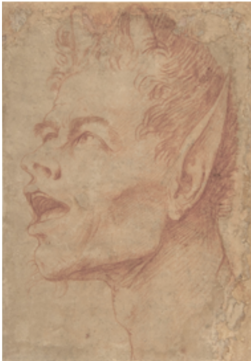
13. Jusepe de Ribera, Tête de satyre 1620-1625. Sanguine sur papier vergé, 30,3×21,1 cm. The Metropolitan museum of Art, New York.