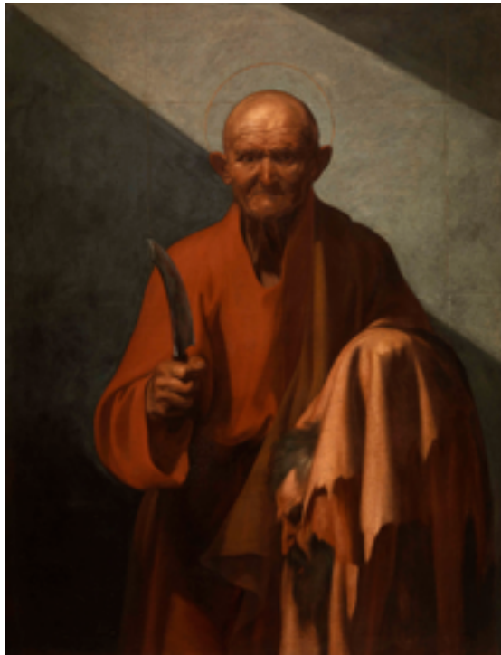
3. Jusepe de Ribera, Saint Barthélémy , 1612. Huile sur toile, 126×97 cm. Fondation Roberto Longhi, Florence.