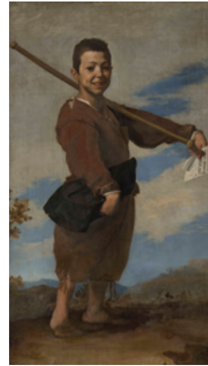
10. Jusepe de Ribera, Le Pied-bot , 1642. Huile sur toile, 164×94. Musée du Louvre, Paris.