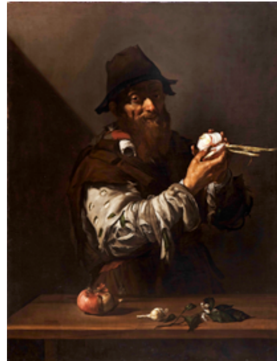
2. Jusepe de Ribera, Allégorie de l'odorat, 1615-1616. Huile sur toile, 114,5×88,3 cm. Collection Abello, Madrid.