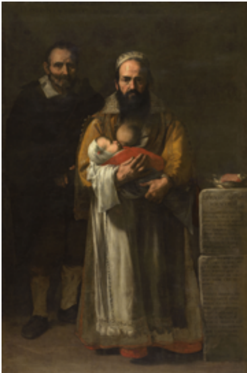
11. Jusepe de Ribera, Maddalena Ventura et son mari dite « La femme à barbe » , 1631. Huile sur toile, 196×127 cm. Hopital Tavera - Fondation Medinacelli, Tolède En dépôt au Musée national du Prado, Madrid.