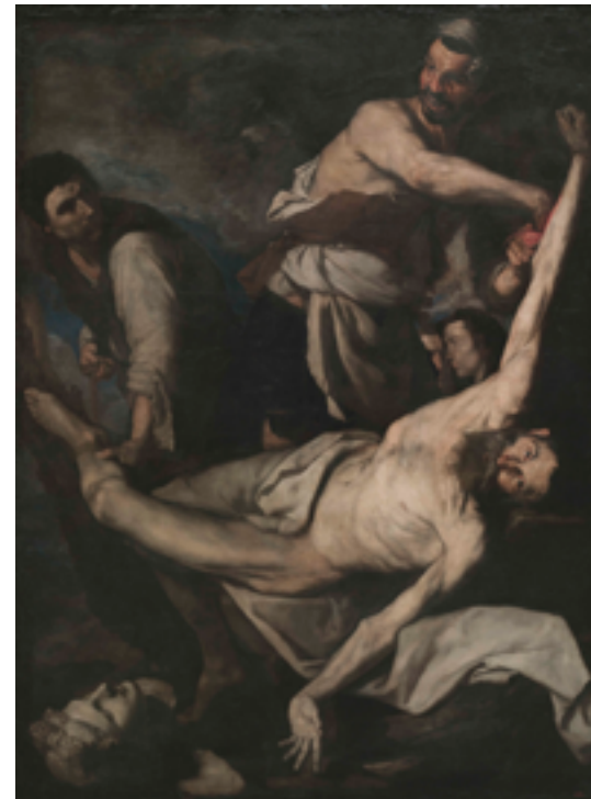
24. Jusepe de Ribera, Martyre de Saint Barthélémy , 1644. Huile sur toile, 202×153 cm. Museu Nacional d'Art de Catalunya.