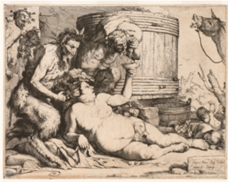
15. Jusepe de Ribera, Silène ivre , 1628. Eau-forte et burin, 27,5×35,4 cm. Petit Palais, musée des Beaux-Arts de la Ville de Paris.