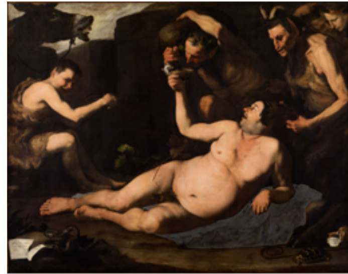
20. Jusepe de Ribera, Silène ivre , 1626. Huile sur toile, 185×229 cm. Su concessione del MiC – Museo e Real Bosco di Capodimonte / Photo L. Romano