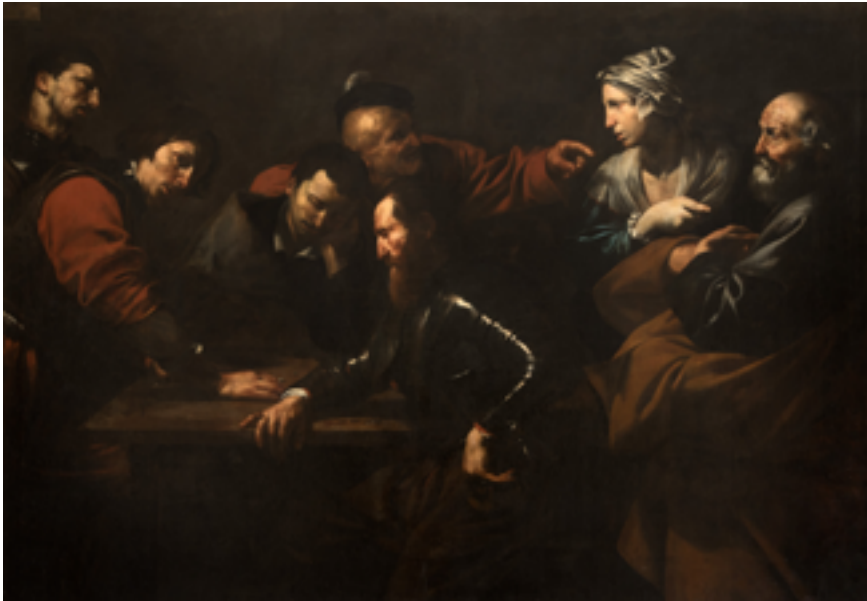
7. Jusepe de Ribera, Le Reniement de Saint-Pierre, 1615-1616. Huile sur toile, 163×233 cm. Galerie Corsini, Rome.