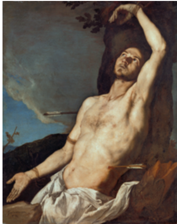
25. Jusepe de Ribera, Saint Sébastien , 1651. Huile sur toile, 121×100 cm. Certosa e Museo Nazionale di San Martino.