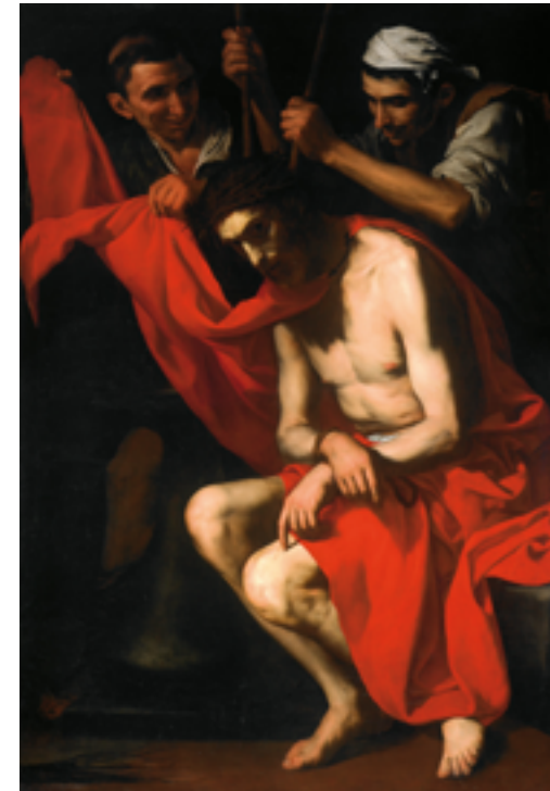
10. Jusepe de Ribera, Le Couronnement d'épines, 1616-1618. Huile sur toile, 197×115 cm. Casa de Alba - Palacio de las Duenas, Séville.