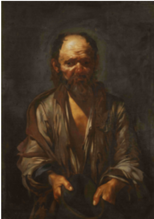
1. Jusepe de Ribera, Un mendiant, 1612-1614. Huile sur toile, 110×78 cm. Galleria Borghese, Rome.