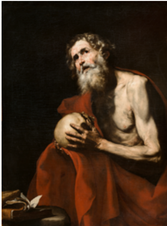
19. Jusepe de Ribera, Saint Jérôme pénitent , 1634. Huile sur toile, 126×78 cm. Museo Nacional Thyssen-Bornemisza Madrid.