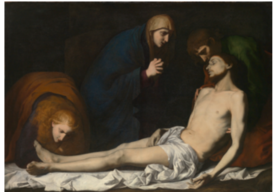
18. Jusepe de Ribera, Lamentation sur le Christ mort, 1618-1623. Huile sur toile, 129,5×181 cm. The National Gallery, Londres