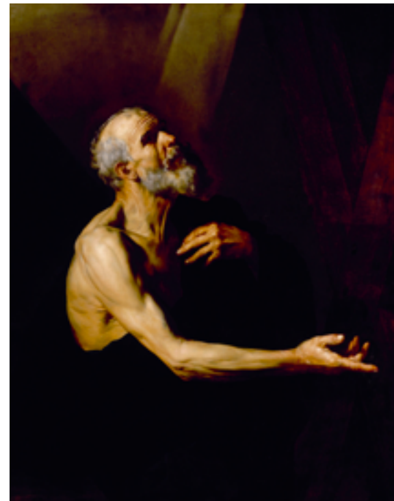
8. Jusepe de Ribera, Saint-André en prière, 1615-1618. Huile sur toile, 132×107,5 cm. Quadreria dei Girolamini, Naples.