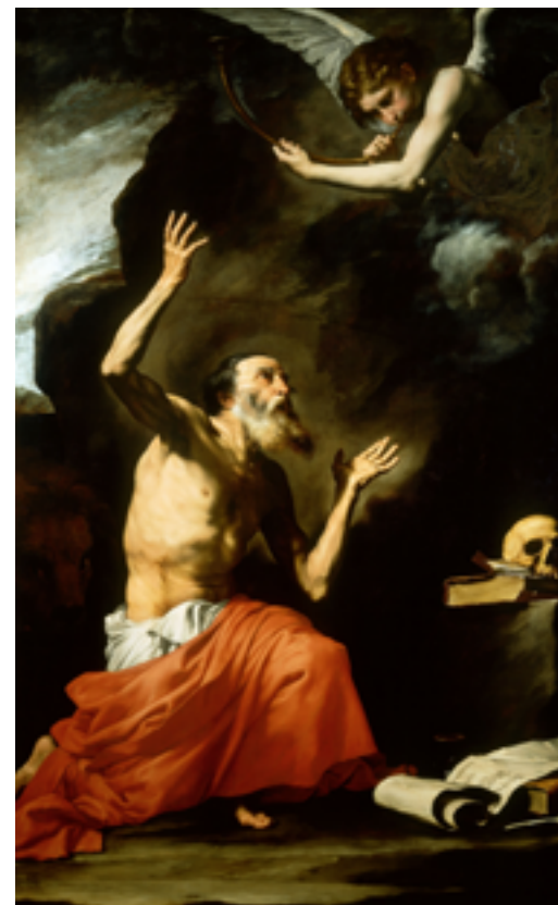
Jusepe de Ribera, Saint Jérôme et l'ange du Jugement dernier , 1626.