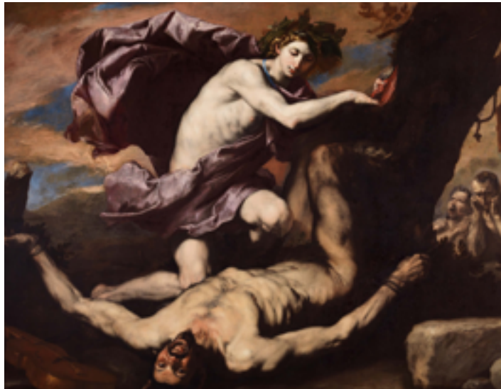
21. Jusepe de Ribera, Apollon et Marsyas , 1637. Huile sur toile, 182×232 cm. Museo e Real Bosco di Capodimonte, Naples. Su concessione del MiC – Museo e Real Bosco di Capodimonte / Photo L. Romano.