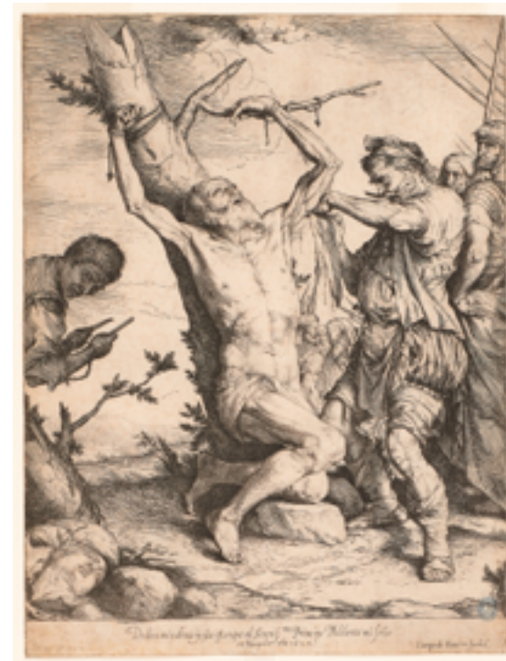
16. Jusepe de Ribera, Le Martyre de saint Barthélemy , 1624. Eau-forte et burin, 31,3×23,7 cm. Petit Palais, musée des Beaux-Arts de la Ville de Paris.