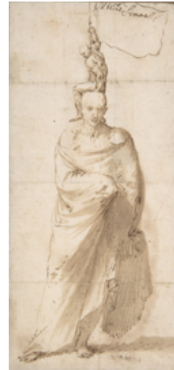
14. Jusepe de Ribera, Homme enveloppé dans une tunique, sur la tête, un petit homme assis avec un étendard 1637-1640. Encre et gouache, 21,2×10 cm. The Metropolitan museum of Art, New York.