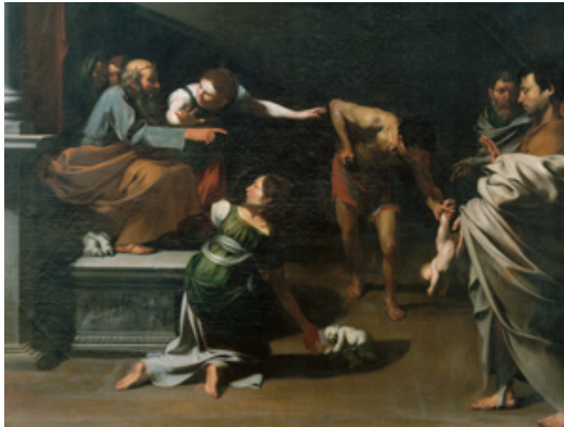
5. Jusepe de Ribera, Le Jugement de Salomon, 1609-1610. Huile sur toile, 153×201 cm. Galleria Borghese, Rome.