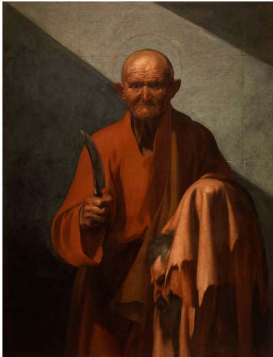
3. Jusepe de Ribera, Saint Barthélémy , 1612. Huile sur toile, 126×97 cm. Fondation Roberto Longhi, Florence.