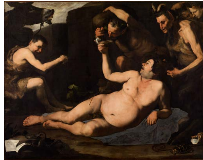
12. Jusepe de Ribera, Silène ivre , 1626. Huile sur toile, 185×229 cm. Museo e Real Bosco di Capodimonte, Naples.