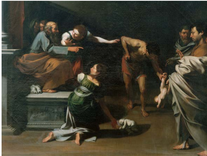
5. Jusepe de Ribera, Le Jugement de Salomon, 1609-1610. Huile sur toile, 153×201 cm. Galleria Borghese, Rome.