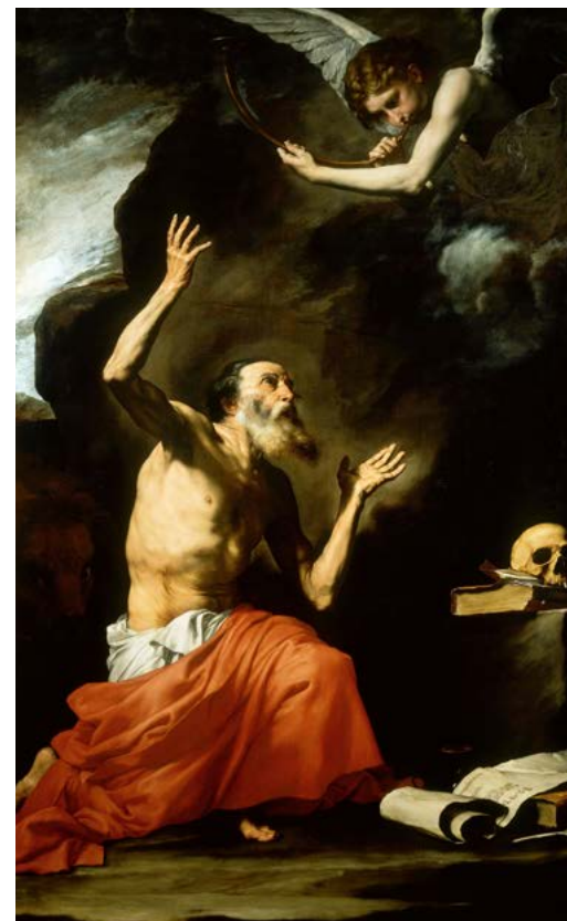
Jusepe de Ribera, Saint Jérôme et l'ange du Jugement dernier , 1626.

Ximun Diharce ximun.diharce@paris.fr +33 1 53 43 40 23