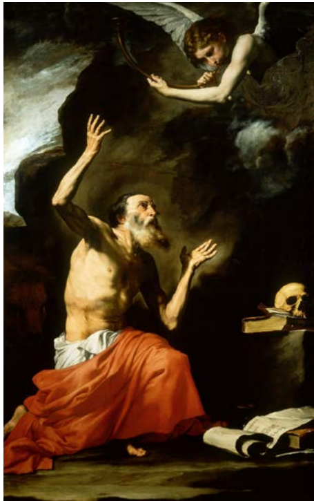
9. Jusepe de Ribera, Saint Jérôme et l'ange du Jugement dernier , 1626. Huile sur toile, 262×164 cm. Museo e Real Bosco di Capodimonte, Naples.