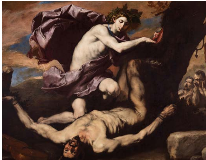
13. Jusepe de Ribera, Apollon et Marsyas , 1637. Huile sur toile, 182×232 cm. Museo e Real Bosco di Capodimonte, Naples.