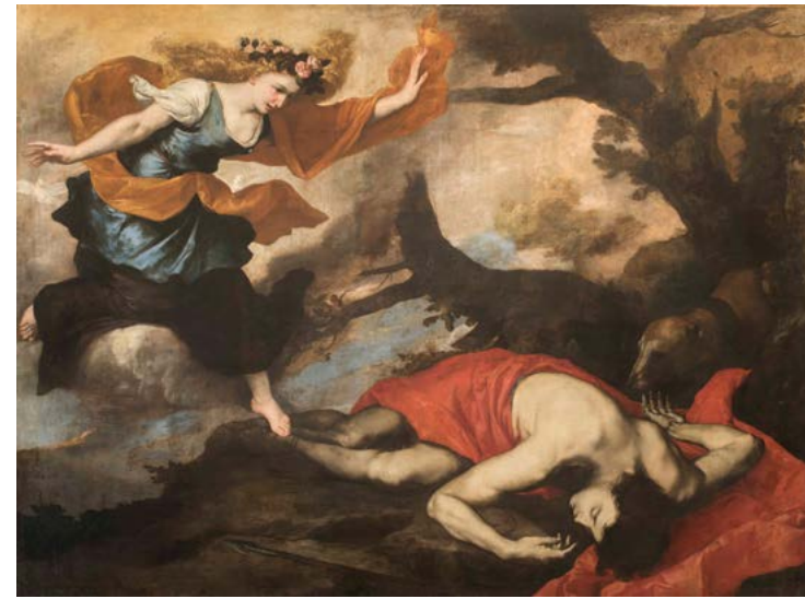
14. Jusepe de Ribera, Vénus et Adonis , 1637. Huile sur toile, 179×262 cm. Galerie Corsini, Gallerie Nazionali di Arte Antica, Rome.