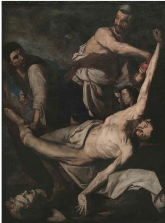
15. Jusepe de Ribera, Martyre de Saint Barthélémy , 1644. Huile sur toile, 202×153 cm. Museu Nacional d'Art de Catalunya.