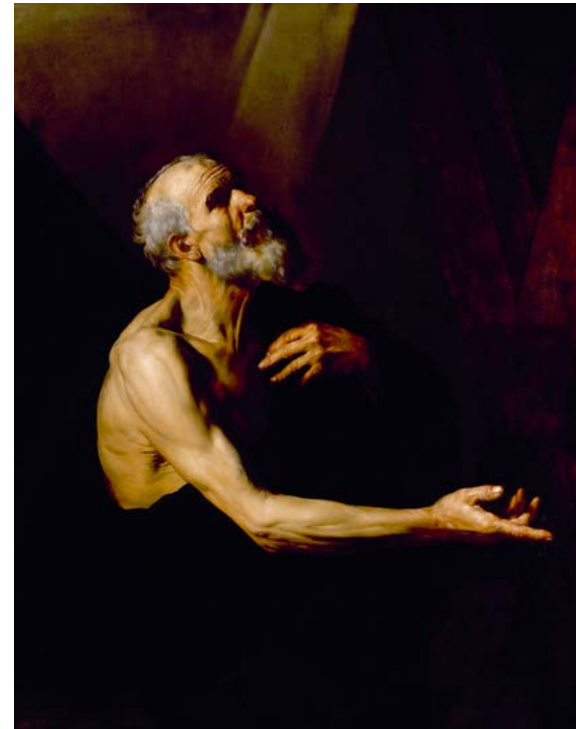
8. Jusepe de Ribera, Saint-André en prière, 1615-1618. Huile sur toile, 132×107,5 cm. Quadreria dei Girolamini, Naples.