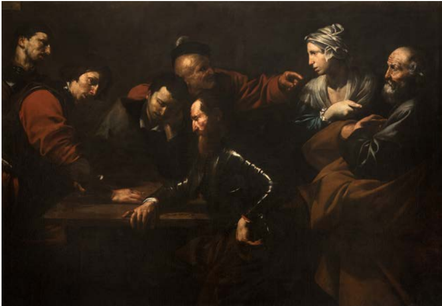
7. Jusepe de Ribera, Le Reniement de Saint-Pierre, 1615-1616. Huile sur toile, 163×233 cm. Galerie Corsini, Rome.