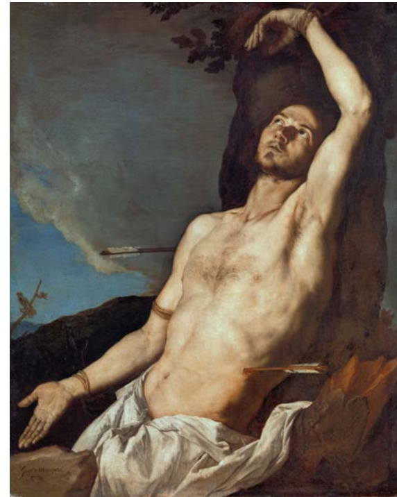
16. Jusepe de Ribera, Saint Sébastien , 1651. Huile sur toile, 121×100 cm. Certosa e Museo Nazionale di San Martino.