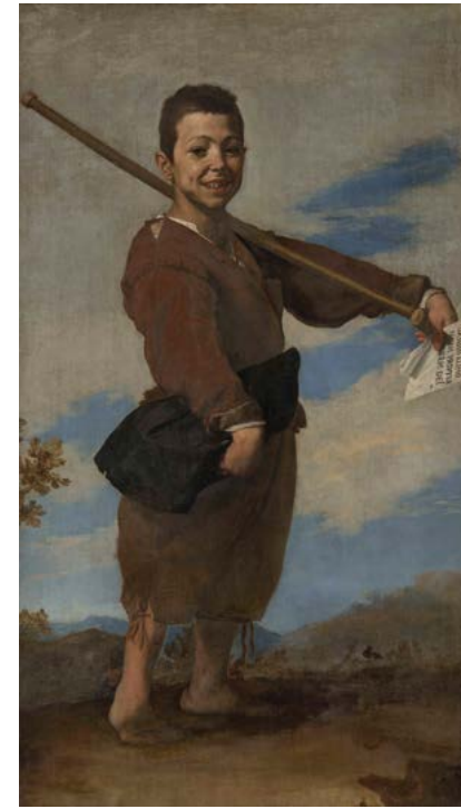
10. Jusepe de Ribera, Le Pied-bot , 1642. Huile sur toile, 164×94. Musée du Louvre, Paris.