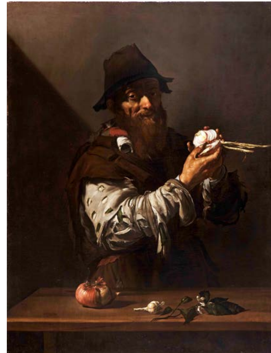
2. Jusepe de Ribera, Allégorie de l'odorat, 1615-1616. Huile sur toile, 114,5×88,3 cm. Collection Abello, Madrid.