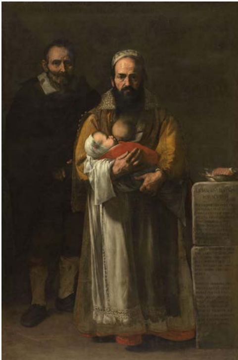
11. Jusepe de Ribera, Maddalena Ventura et son mari ( La femme à barbe ), 1631. Huile sur toile, 196×127 cm. Hopital Tavera - Fondation Medinaceli, Tolède En dépôt au Musée du Prado, Madrid. © Fundación Casa Ducal de Medinaceli, on deposit at the Museo Nacional del Prado © Photographic Archive, Museo Nacional del Prado. Madrid