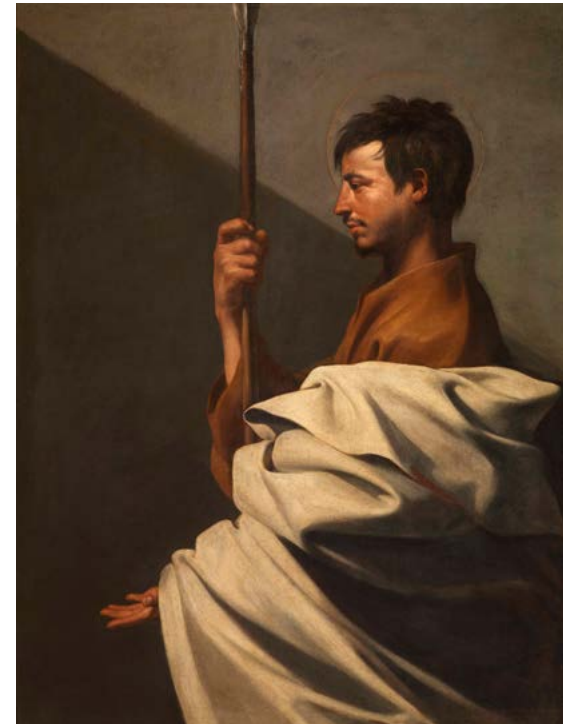
4. Jusepe de Ribera, Saint Thomas , 1612. Huile sur toile, 126×97 cm. Fondation Roberto Longhi, Florence.