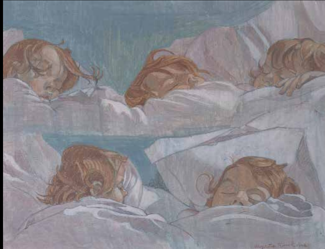
9. Augustin Rouart, Cinq portraits d'enfant endormi , 1948