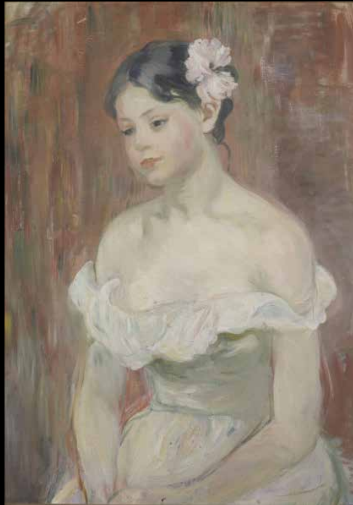
3. Berthe Morisot, Jeune fille au décolleté, la fleur aux cheveux , 1893.