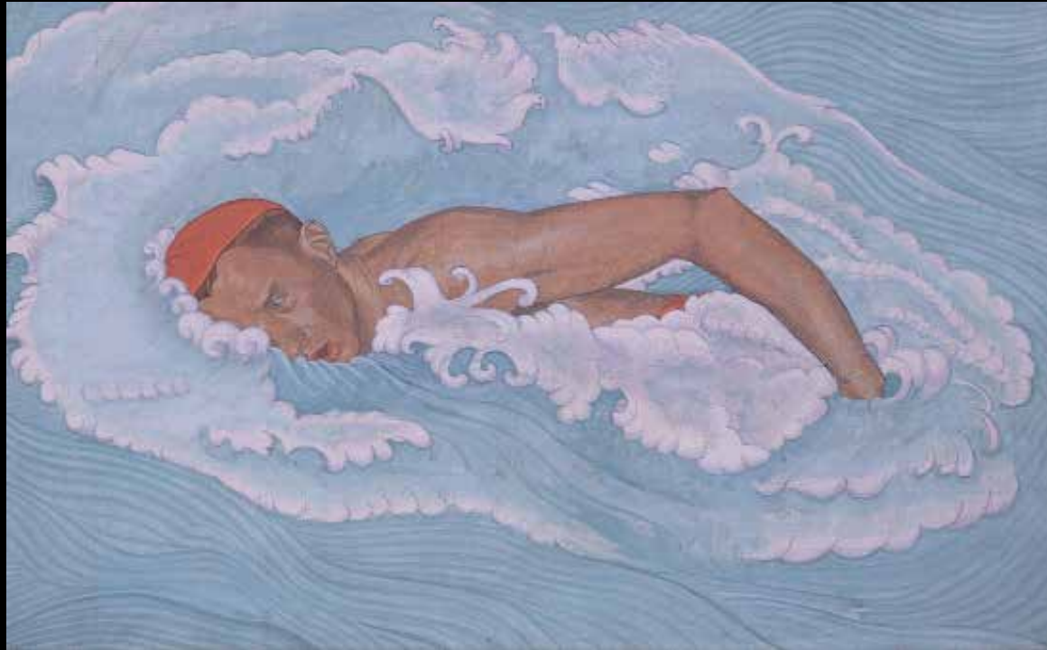
5. Augustin Rouart, Le Nageur , 1943