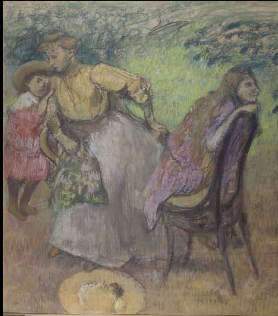
2. Edgar Degas, Madame Alexis Rouart et ses enfants , vers 1905.