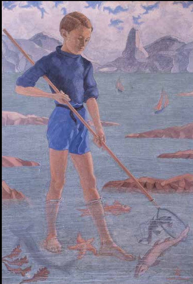
4. Augustin Rouart, Le Petit Pêcheur , 1943