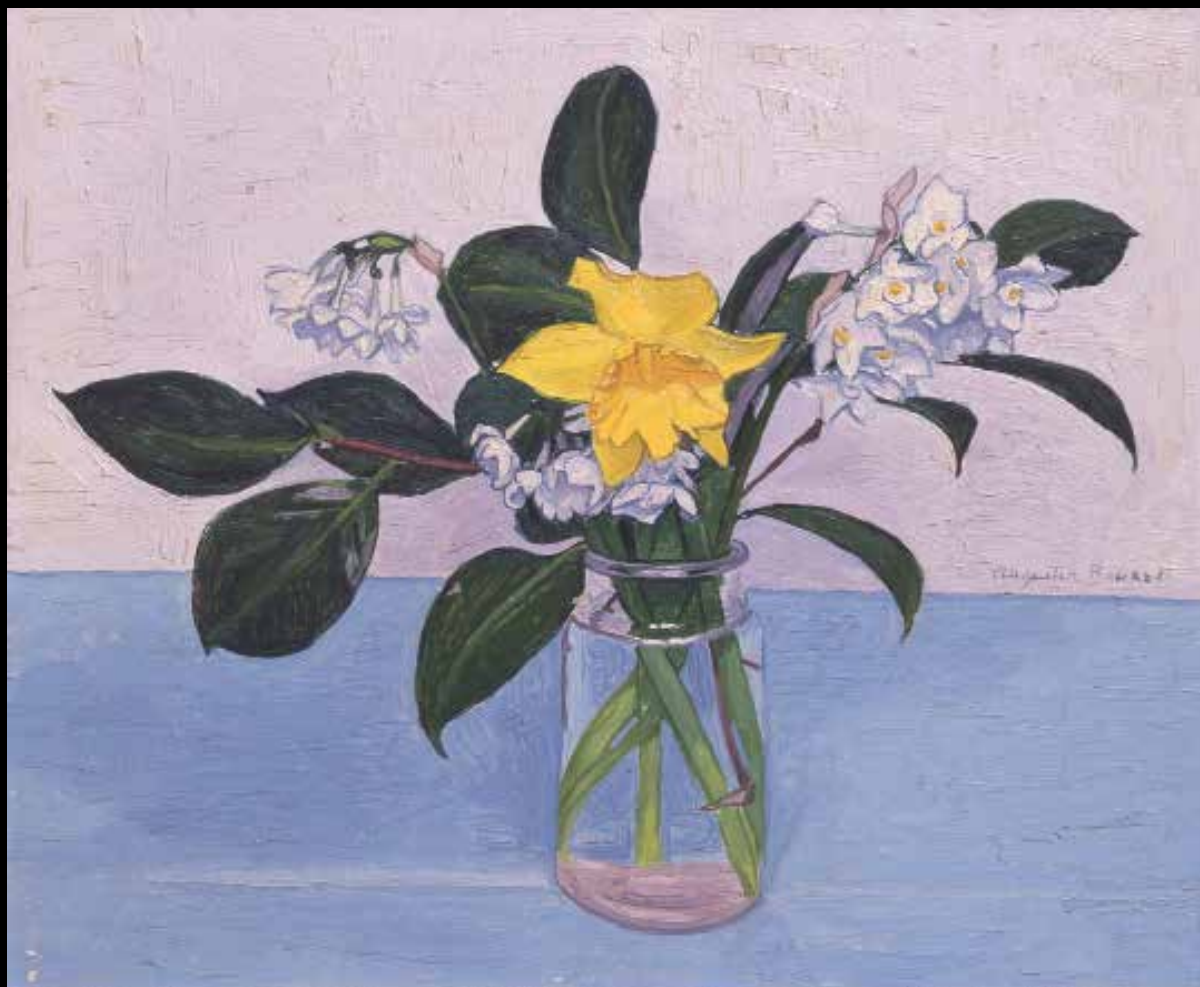
10. Augustin Rouart, Jonquille et narcisses dans un bocal en verre , 1954