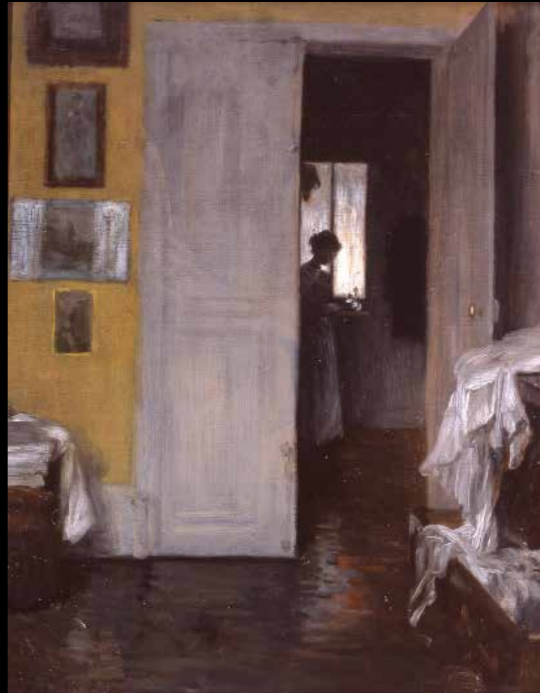
1. Henry Lerolle, Intérieur , vers 1880