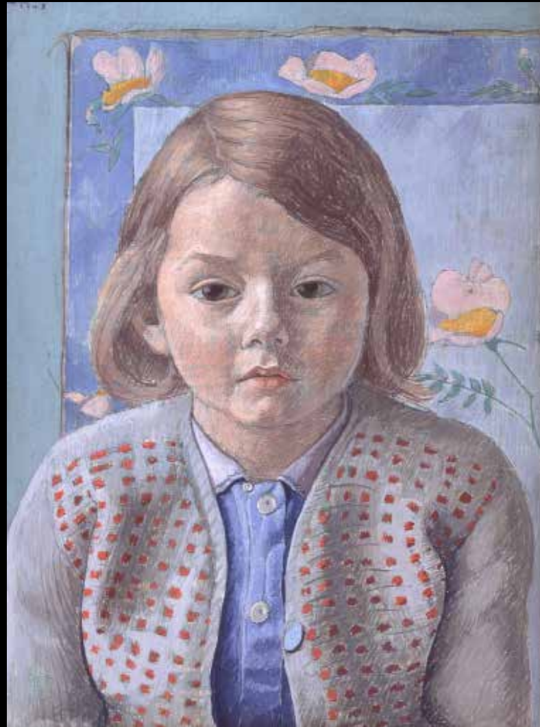
8. Augustin Rouart, L'Enfant au gilet rouge , 1948