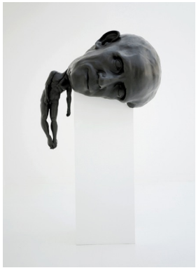
Thomas Leroy Crash , 2009 Bronze 180 × 100 × 75 cm

Petit Palais - Musée des Beaux-Arts de la Ville de Paris