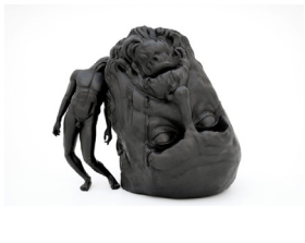
Thomas Leroy Not enough brain to survive , 2009 Bronze 138 × 120 × 120 cm