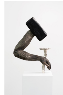
Thomas Leroy Destroy Everything You Touch , 2014 Bronze, patine, argent 71 × 50 × 19 cm