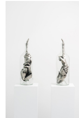
Thomas Leroy I don't need me , 2014 Bronze, patine, verre 56 × 15 × 15 cm