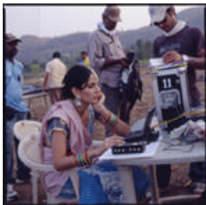
Katrina Kaif, star de Bollywood, lors du tournage d'un film de la réalisatrice indienne Farah Khan. Malsej Ghat, Etat du Maharashtra, Inde.

Certaines femmes sont désormais des réalisatrices et des chorégraphes célèbres comme Farah Khan ou Vaibhavi Merchant, ou interviennent en tant qu'assistantes à la mise en scène, sont costumières ou éclairagistes, des métiers techniques qui étaient autrefois l'apanage des hommes, et qui se sont féminisés à partir des années 1980.