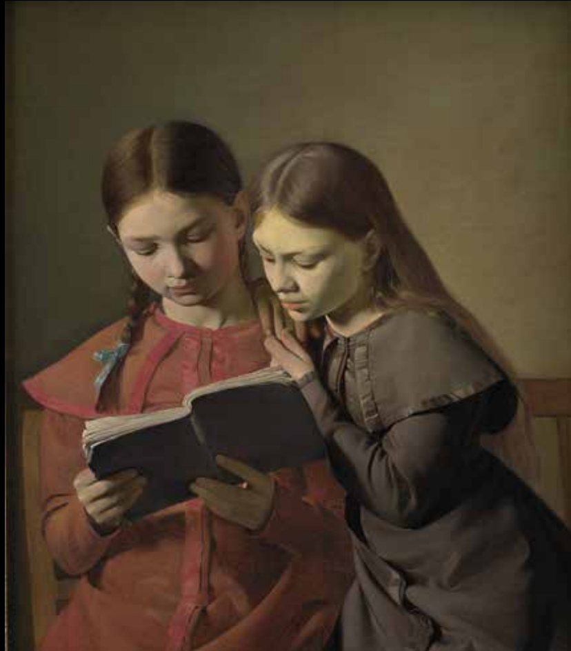
5. Constantin Hansen, Signe et Henriette Hansen, sœurs de l'artiste , 1826 Huile sur toile, 65,5 x 56 cm, Copenhague, Statens Museum for Kunst