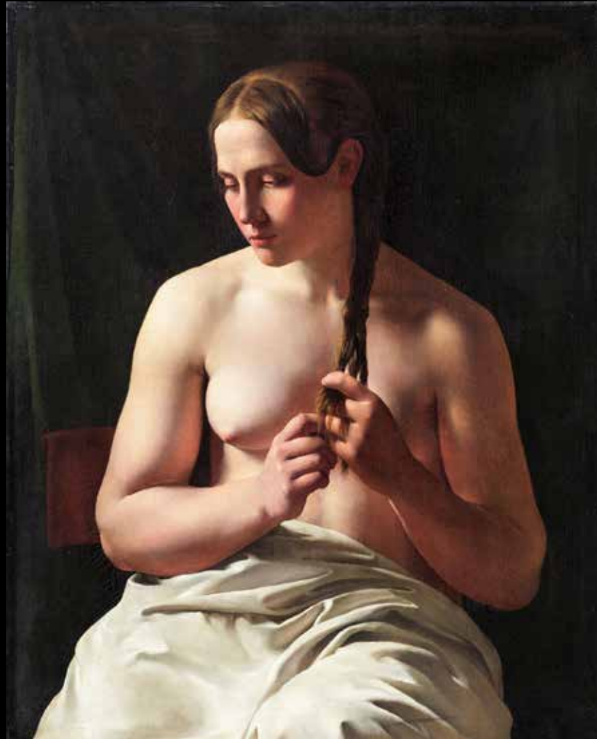
7 Ludvig August Smith, Femme se tressant les cheveux , 1839. Huile sur toile, 76x60 cm, Stockholm, Nationalmuseum.