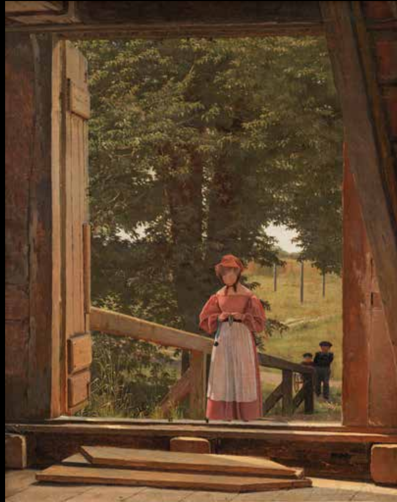
17. Christen Købke, Vue du haut d'un grenier à blé dans la citadelle de Copenhague , 1831 Huile sur toile, 39 x 30,5 cm, Copenhague, Statens Museum for Kunst