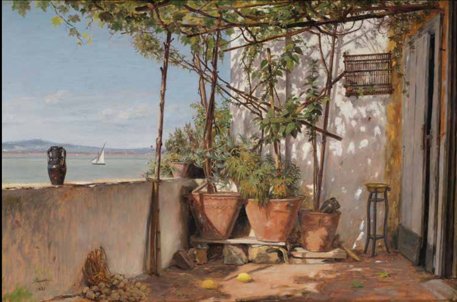
10. Martinus Rørbye, Loggia à Procida , 1835 Huile papier collé sur toile, 32 x 475 cm, Stockholm, Nationalmuseum