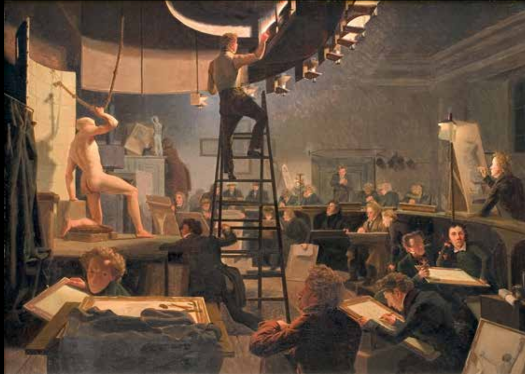
2. Wilhelm Bendz, L'École de modèle vivant à l'Académie des beaux-arts de Copenhague , 1826 Huile sur toile, 577x82,5 cm, Copenhague, Statens Museum for Kunst