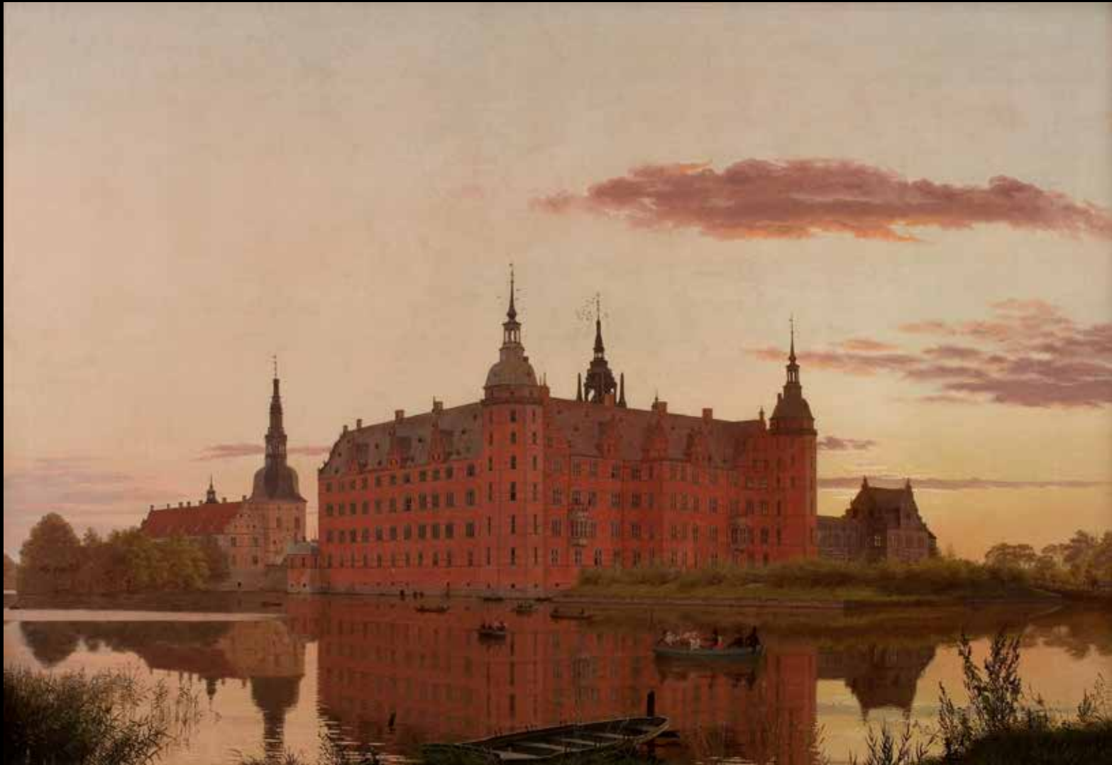
13. Christen Købke, Château de Frederiksborg vu de Jaegerbakken. Le soir , 1835. Huile sur toile, 71,8 x 103,4 cm, Copenhague, Hirschsprung Museum