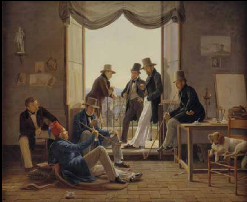
8. Constantin Hansen, Un Groupe d'artistes danois à Rome , 1837 Huile sur toile, 62 x 74 cm, Copenhague, Statens Museum for Kunst