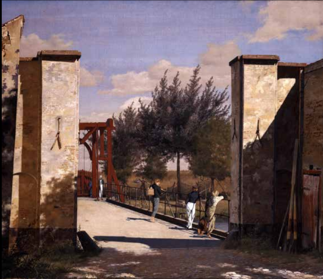
16. Christen Købke, Vue depuis la citadelle, côté nord , 1834 Huile sur toile, 79 x 93 cm, Ny Carlsberg Glyptotek