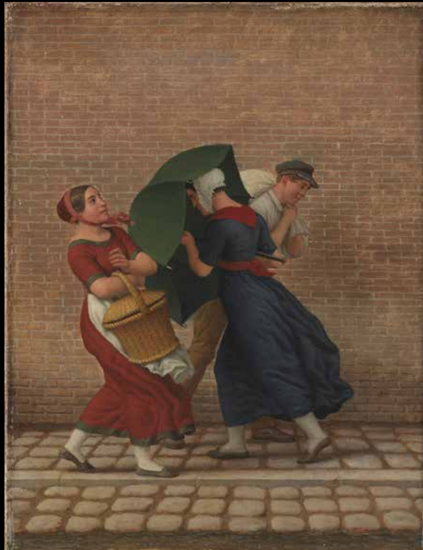
1. Christoffer Wilhelm Eckersberg, Scène de rue sous la pluie et le vent , 1846 Huile sur toile, 34,8 x 26,6 cm, Copenhague, Statens Museum for Kunst