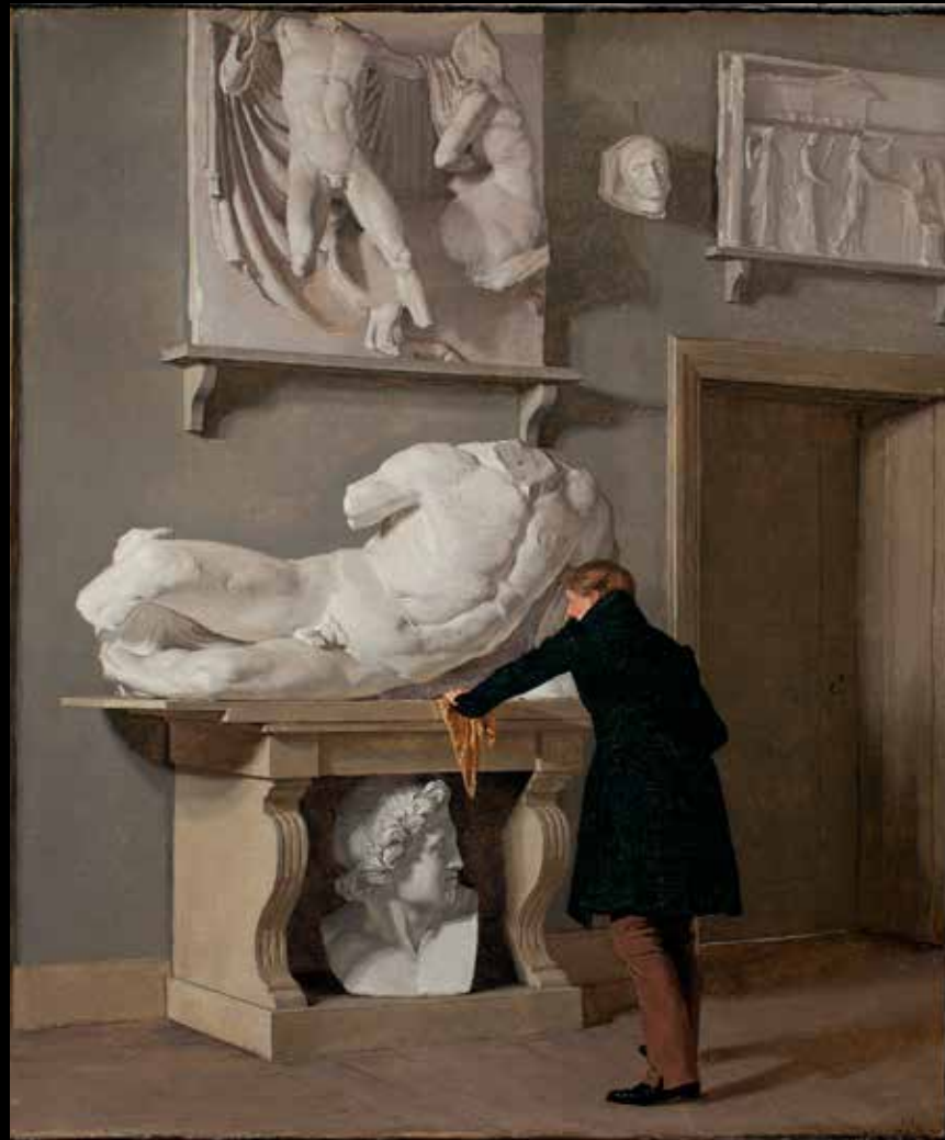
4. Christen Købke, La Collection de plâtres de Charlottenborg , 1830. Huile sur toile, 41,5x 36 cm Copenhague, collection Hirschsprung, © Collection Hirschsprung