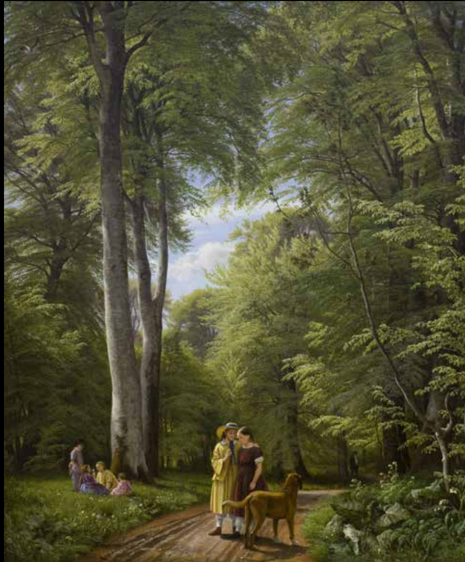
12. Peter Christian Skovgaard, Forêt de hêtres en mai. Iselingen , 1857 Huile sur toile, 189,5 x 158,5 cm, Copenhague, Statens Museum for Kunst