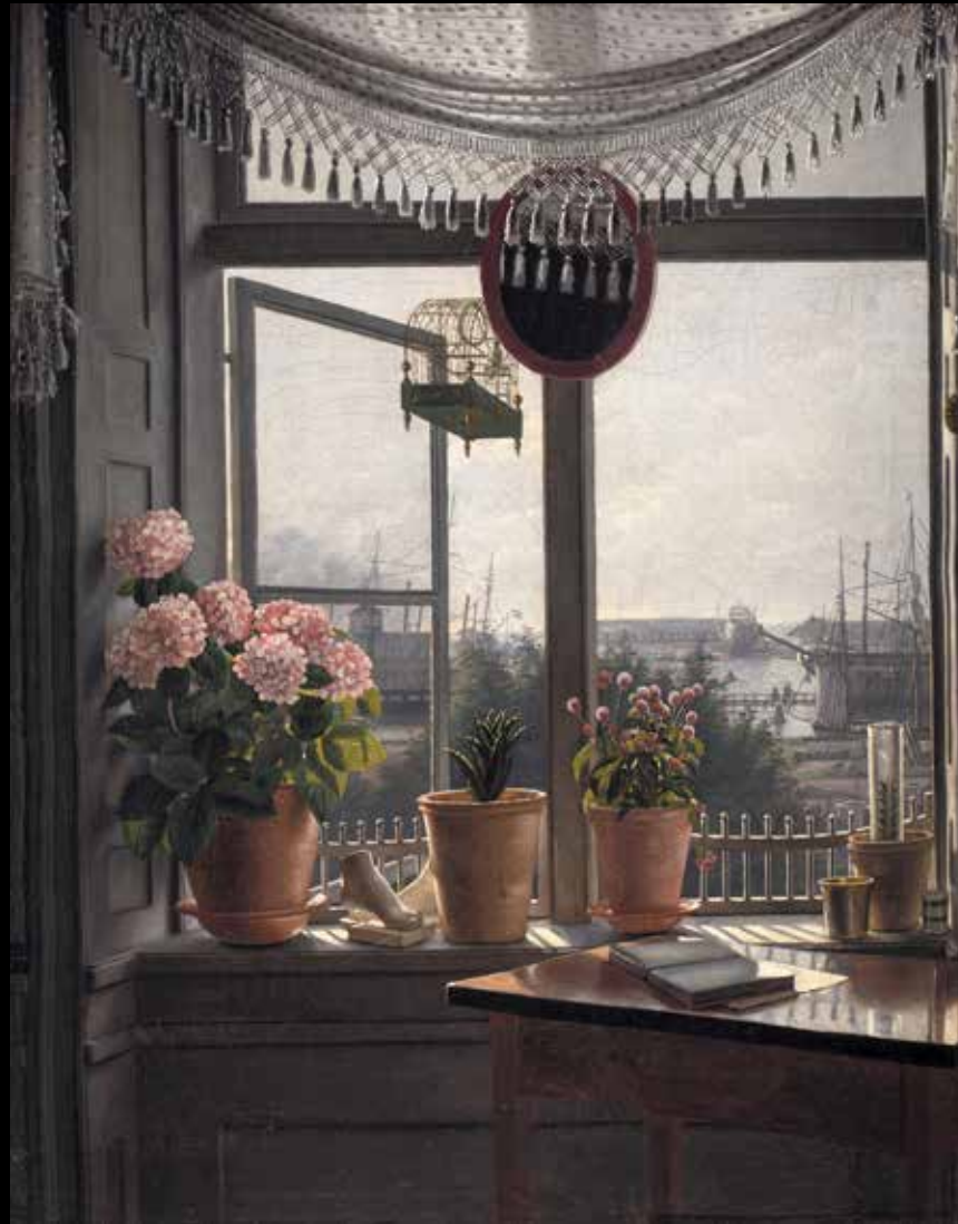
18. Martinus Rørbye, Vue depuis la fenêtre du peintre , 1825. Huile sur toile, 38 x 29,8 cm, Copenhague, Statens Museum for Kunst