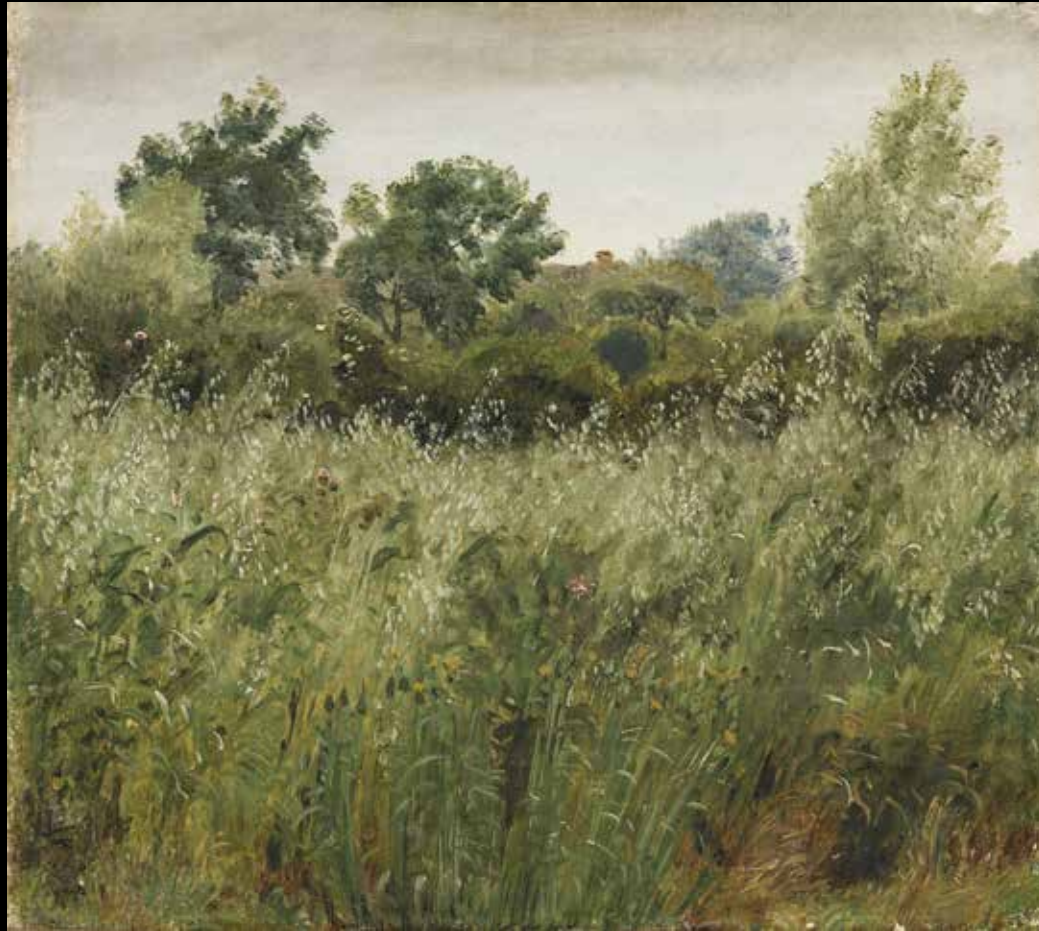
11. Peter Christian Skovgaard, Champ d'avoine à Vejby , 1843 Huile sur toile, 25,5 x 28,5 cm, Copenhague, Statens Museum for Kunst