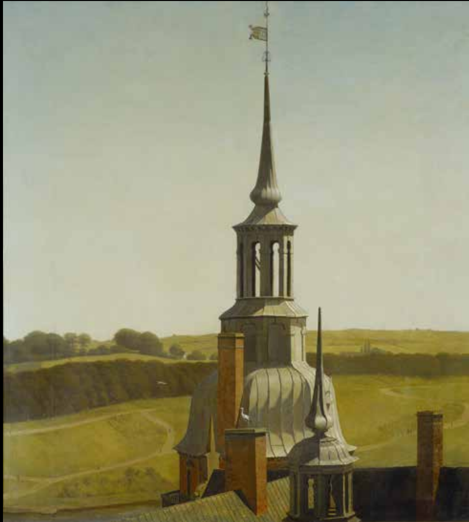
15. Christen Købke, Une des petites tours du château de Frederiksborg, vers 1834-1835 Huile sur toile, 177 x 162 cm, Copenhague, Designmuseum Danmark