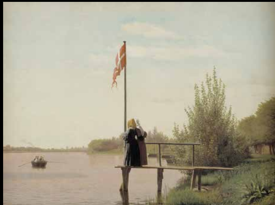
Christen Købke (1810-1848), Vue de Dosseringen, 1838. Huile sur toile, 53 x 71,5 cm, Copenhague, Statens Museum for Kunst