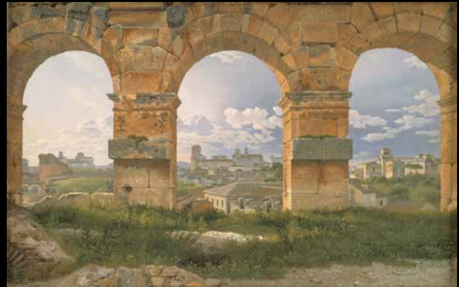
9. Christoffer Wilhelm Eckersberg, Vue à travers trois arches du troisième étage du Colisée , 1815. Huile sur toile, 32 x 49,5 cm, Copenhague, Statens Museum for Kunst