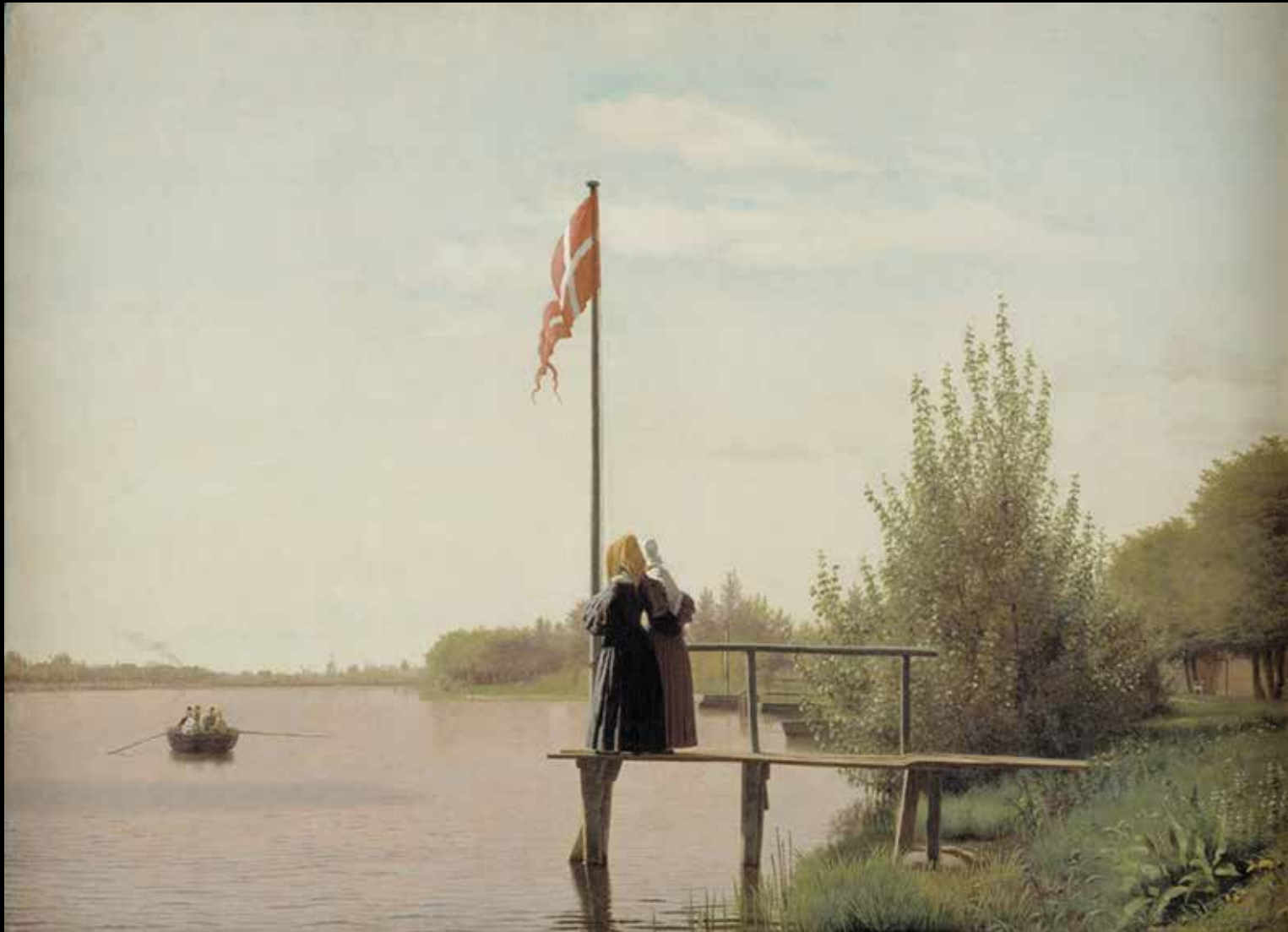
14. Christen Købke (1810-1848), Vue de Dosseringen, 1838. Huile sur toile, 53 x 71,5 cm, Copenhague, Statens Museum for Kunst